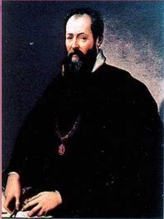
Джорджо Вазари (1511-1574)

Итальянский живописец, архитектор и писатель.