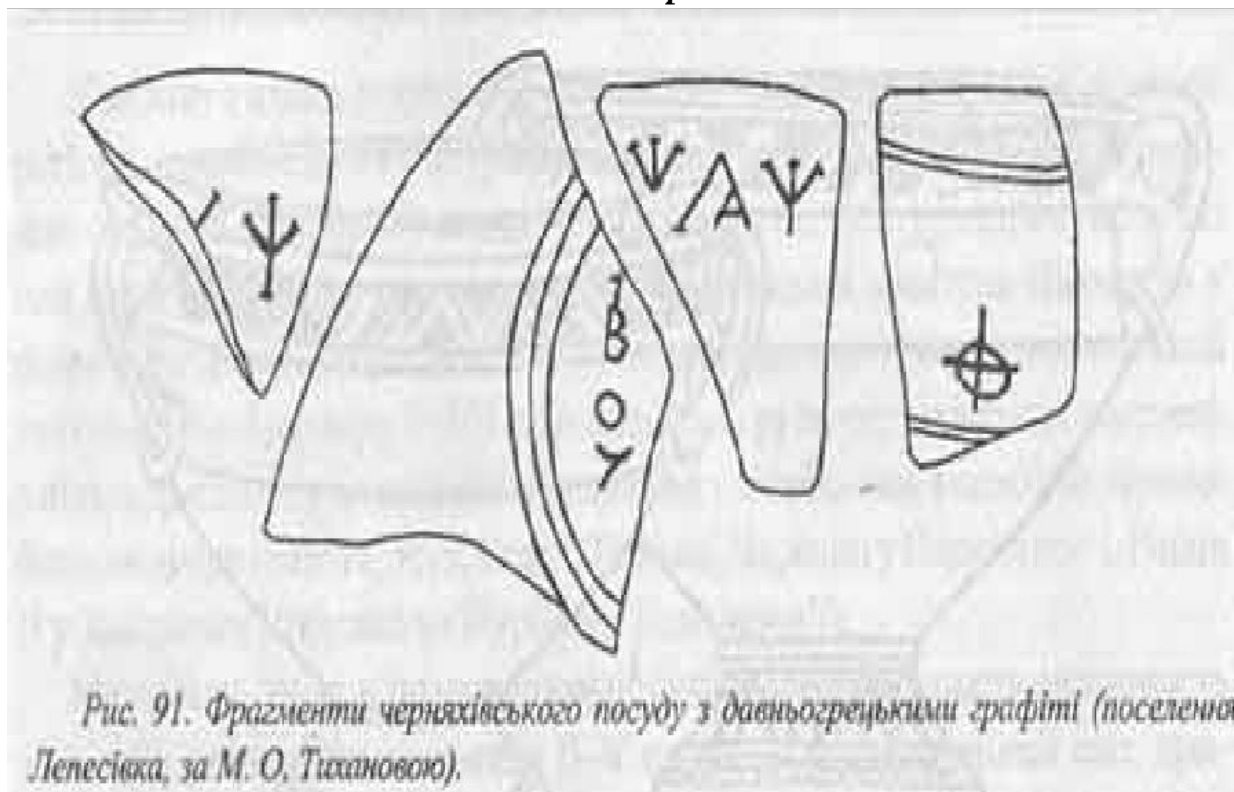
Рис. 91. Фрагменти черняхівського посуду з давньогрецькими графіті (поселення Лепесівка, за М. О. Тихановою).

в) зарубки на дереві, що використовувалися найчастіше для обліку днів, для складання боргових зобов'язань. Очевидно, згадувані в давніх книжках давньоруські «черти і різи» й були зарубками на дерев'яних паличках, дощечках, якими користувалися наші далекі предки для фіксації думок. Це вже можна вважати зачатками справжнього письма.