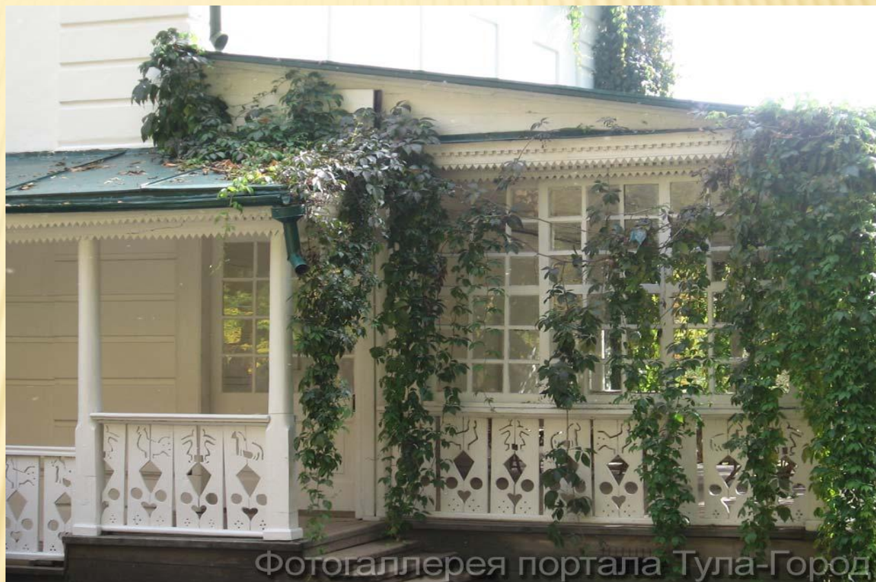
Фотогалерея портала Тула-Город

Давайте зайдём в дом, где жил писатель. В летние месяцы вся семья Толстых перебиралась сюда, на террасу. Здесь обедали, пили чай, принимали посетителей. При жизни Л. Толстого терраса была обвита густо разросшимся диким виноградом.