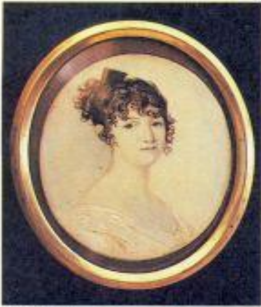
Н. О. Пушкина