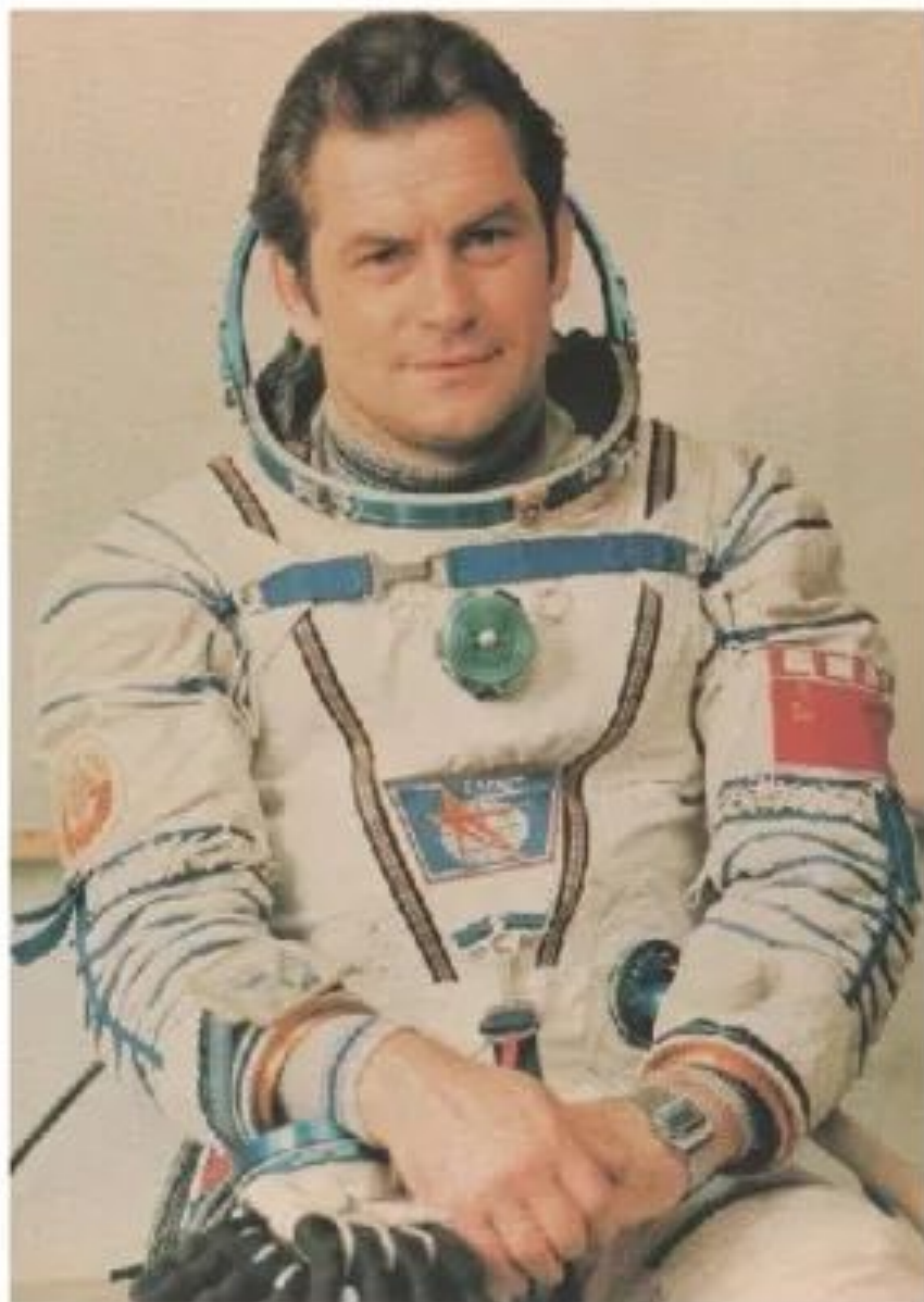
Дважды Герой Советского Союза КОВАЛЕНКО ВЛАДИМИР ВАСИЛЬЕВИЧ