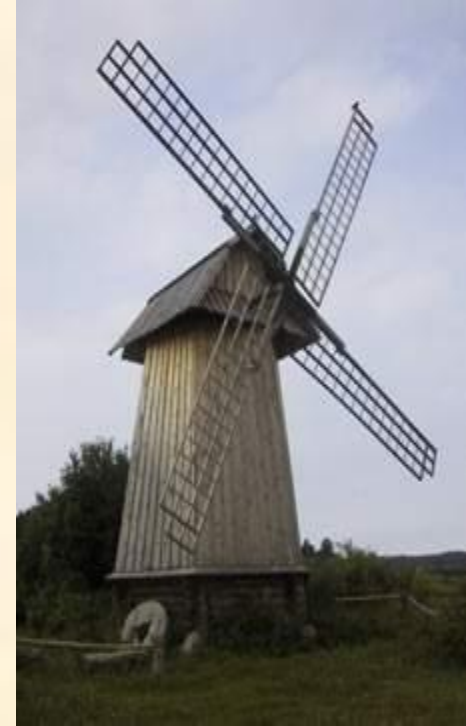
Мельница в усадьбе