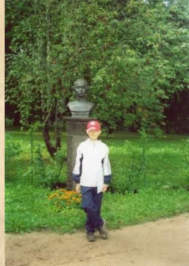
Бюст Абраму Ганнибалу в Петровском

В деревне, где Петра питомец Царей, цариц любимый раб И их забытый однодomeц, Скрывался прадед мой аран,