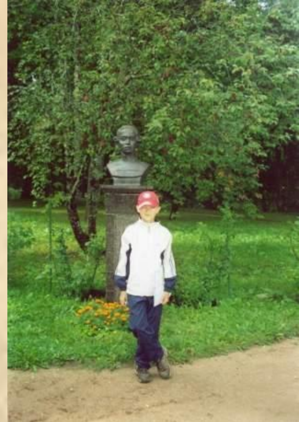
Бюст Абраму Ганнибалу в Петровском

В деревне, где Петра питомец Царей, цариц любимый раб И их забытый однодомец, Скрывался прадед мой аран,