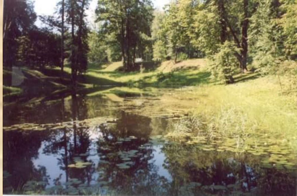
Один из трёх прудов в парке усадьбы