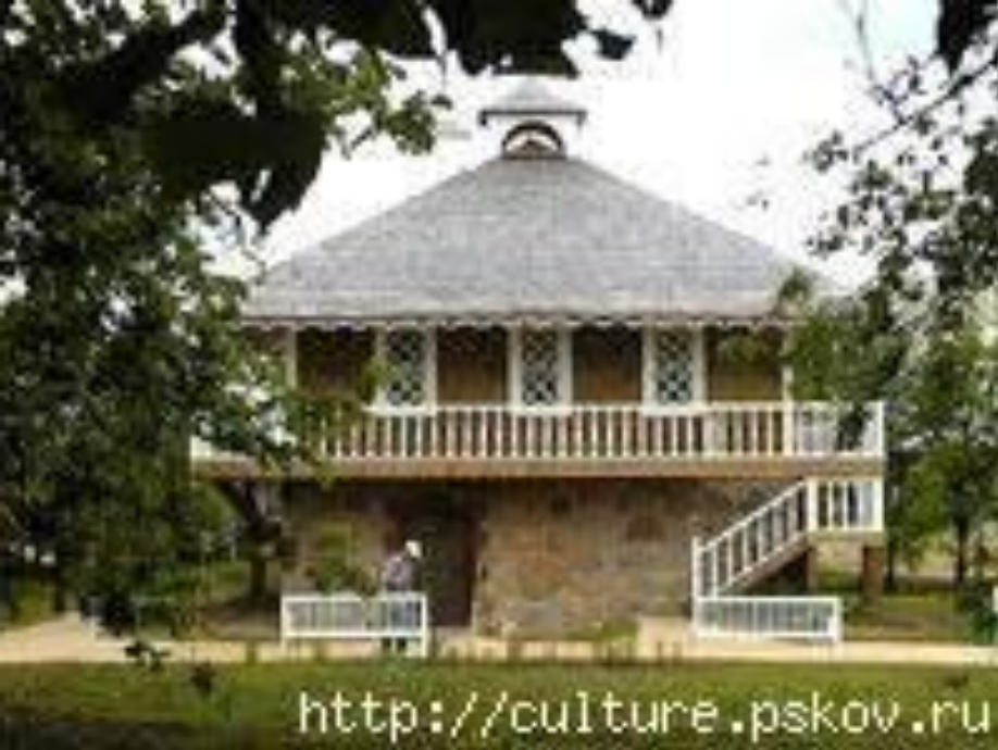
Дом А.П. Ганнибала