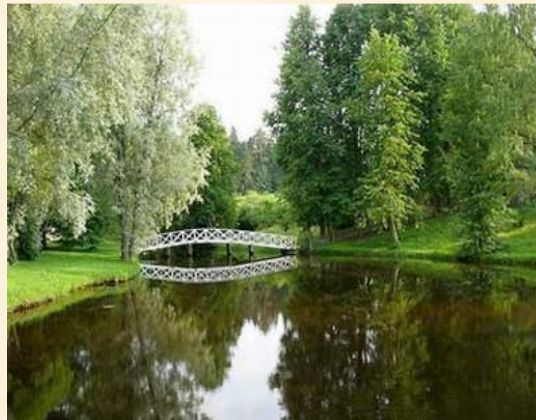
Пруд и мостик в парке