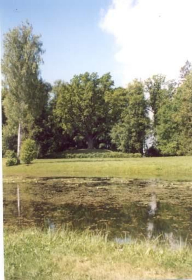
Дуб в парке Тригорского