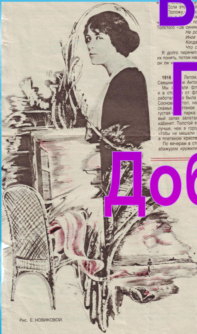
Рис. Е. НОВИКОВОЙ.