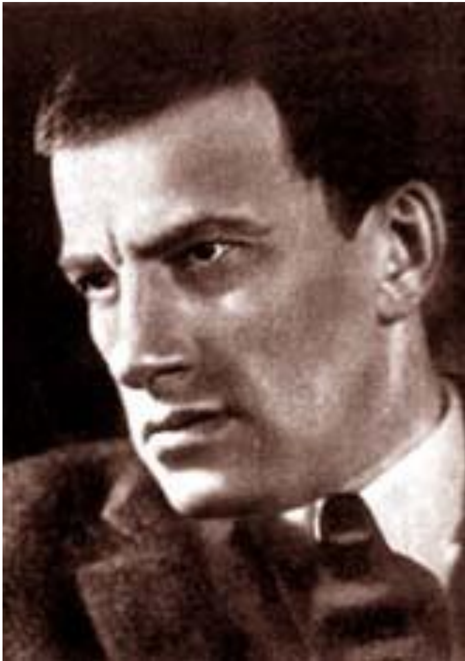
Владимир Маяковский 1893 - 1930