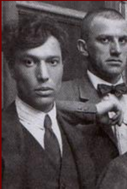
Маяковский и Б Пастернак.

Стихи Маяковского были впервые опубликованы в 1912 году в альманахе группы «Гилея». «Пощечина общественному вкусу», где был помещен и манифест, подписанный им самим В.В Хлебниковым, А.Е Крученых, и Д. Бурлюком, в нарочито эпатирующей форме заявлявший о разрыве с традициями русской классики, необходимости создания нового языка литературы, соответствующего эпохе.