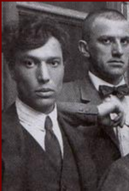
Маяковский и Б Пастернак.

Стихи Маяковского были впервые опубликованы в 1912 году в альманахе группы «Гилея». «Пощечина общественному вкусу», где был помещен и манифест, подписанный им самим В.В Хлебниковым, А.Е Крученых, и Д. Бурлюком, в нарочито эпатирующей форме заявлявший о разрыве с традициями русской классики, необходимости создания нового языка литературы, соответствующего эпохе.