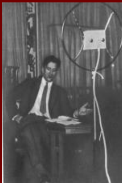
Маяковский на радио.

В 1915—1917 гг. Маяковский проходит военную службу в Петрограде в автошколе. 17 декабря 1918 г. поэт впервые прочел со сцены Матросского театра стихи "Левый марш (Матросам)". В марте 1919 г. он переезжает в Москву, начинает активно сотрудничать в РОСТА (Российское телеграфное агентство), оформляет (как поэт и как художник) для РОСТА агитационно-сатирические плакаты ("Окна РОСТА").