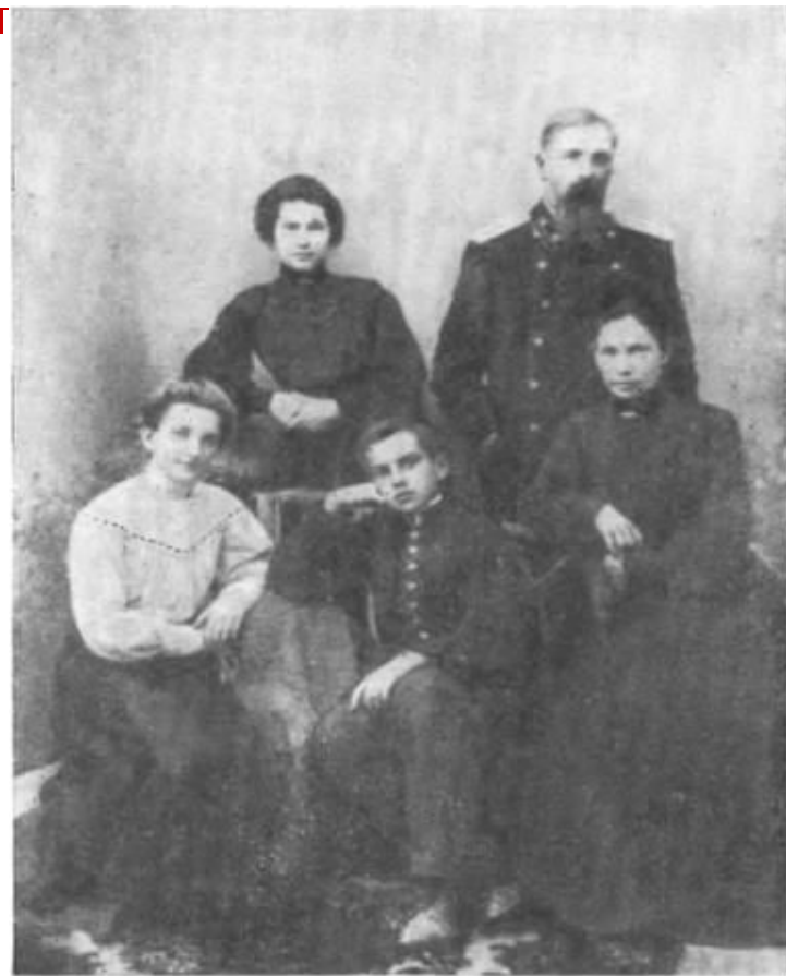
Семья Маяковских. Кутаиси, 1905.