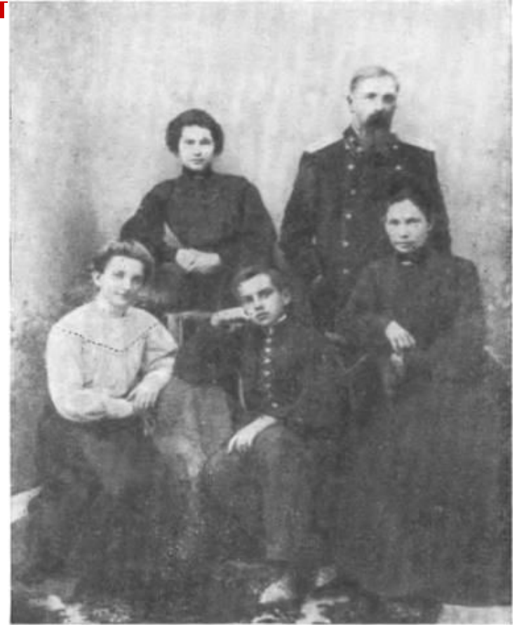
Семья Маяковских. Кутаиси, 1905.