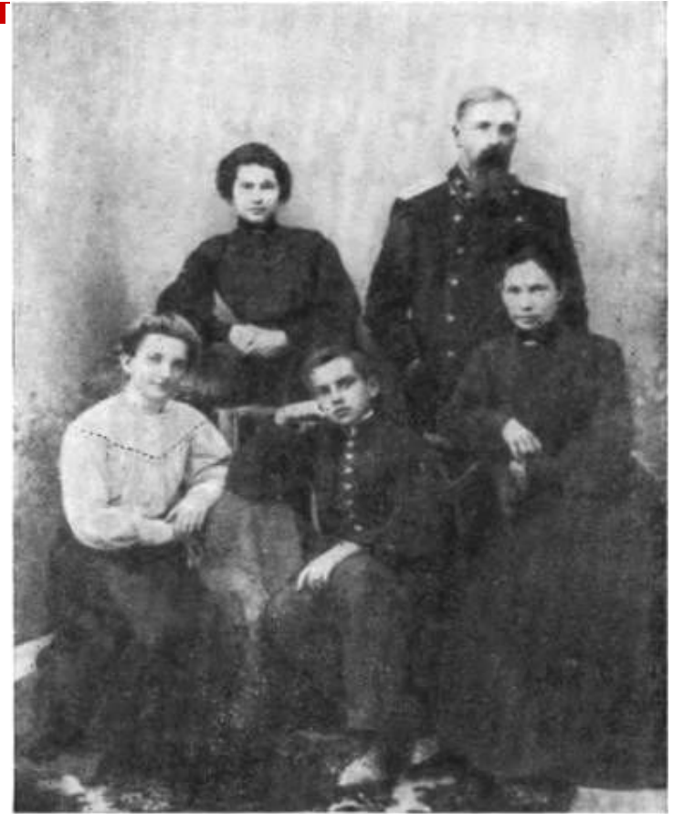
Семья Маяковских, Кутаиси, 1905.