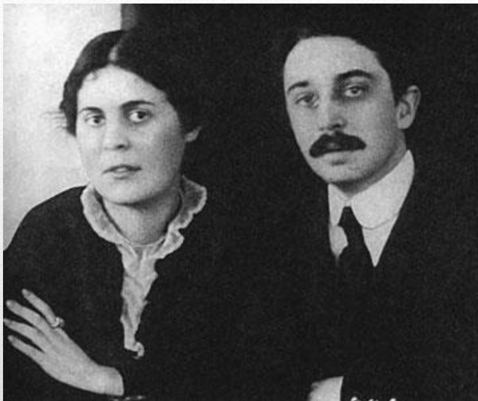
Остап и Лиля Брик.