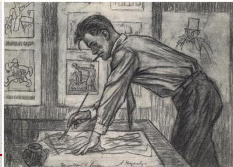
В.В.Маяковский за работой в окнах РОСТА. Рисунок художника А.Нюренберга