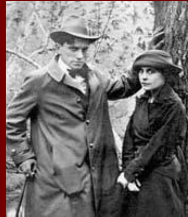
В. В. Маяковский и Л. Ю. Брик

Поэма "Во весь голос" (1930) воспринимается как поэтическое завещание Маяковского, полное глубокой внутренней веры в торжество коммунизма.