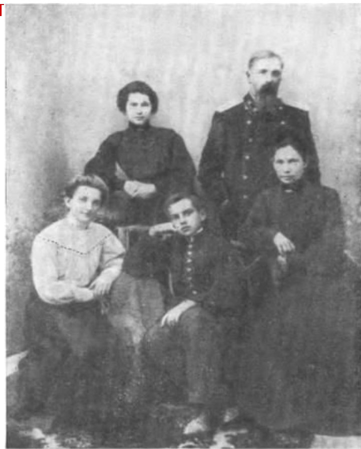
Семья Маяковских. Кутаиси, 1905.