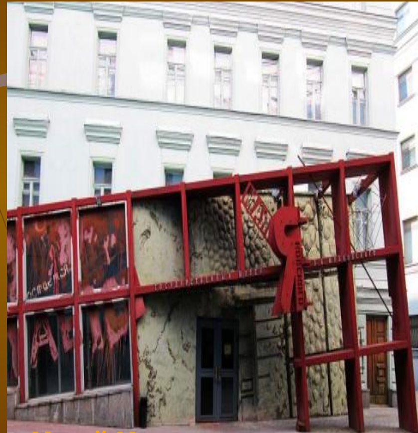
Музей Маяковского в Москве.