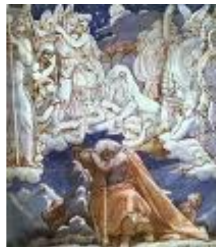
Ж. Д. Энгр «Финн Мак –Кумхайл»