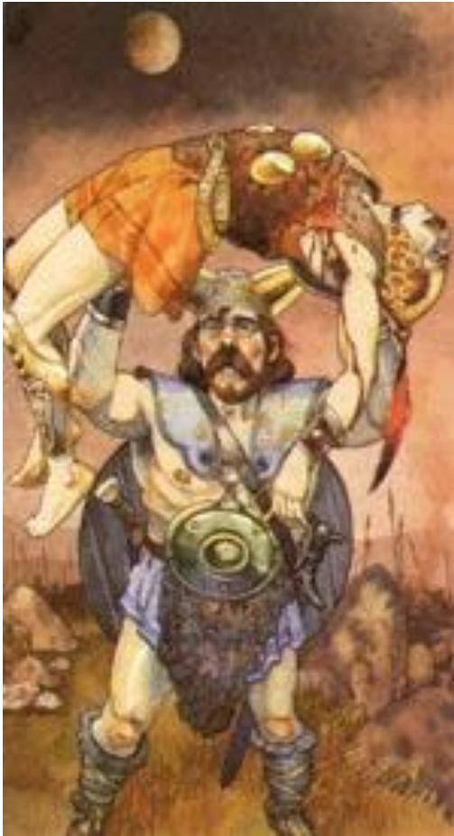
Г. Гаудензи «Кухулин»