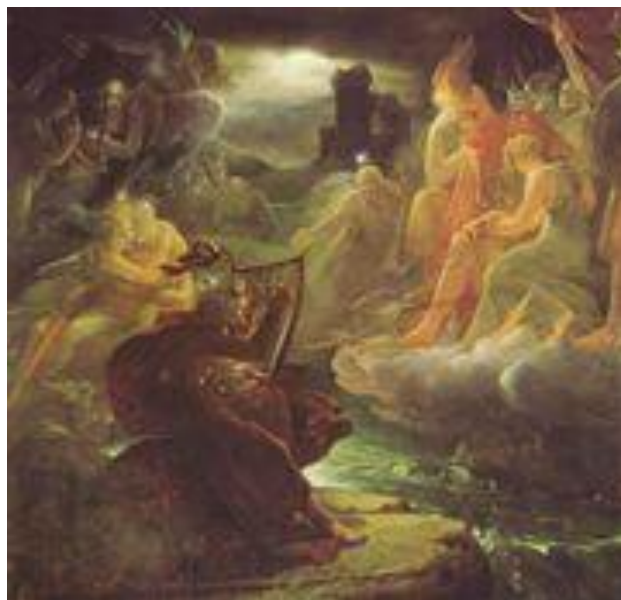
Ж. Ф. Паскаль «Оссиан» Акварель Волошинина «Оссиан»