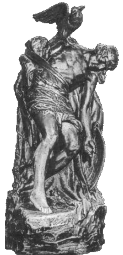
Дублин. Скульптура «Умирающий Кухулин»