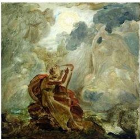
Ф. Жерард «Оссиан, вызывающий призраков»