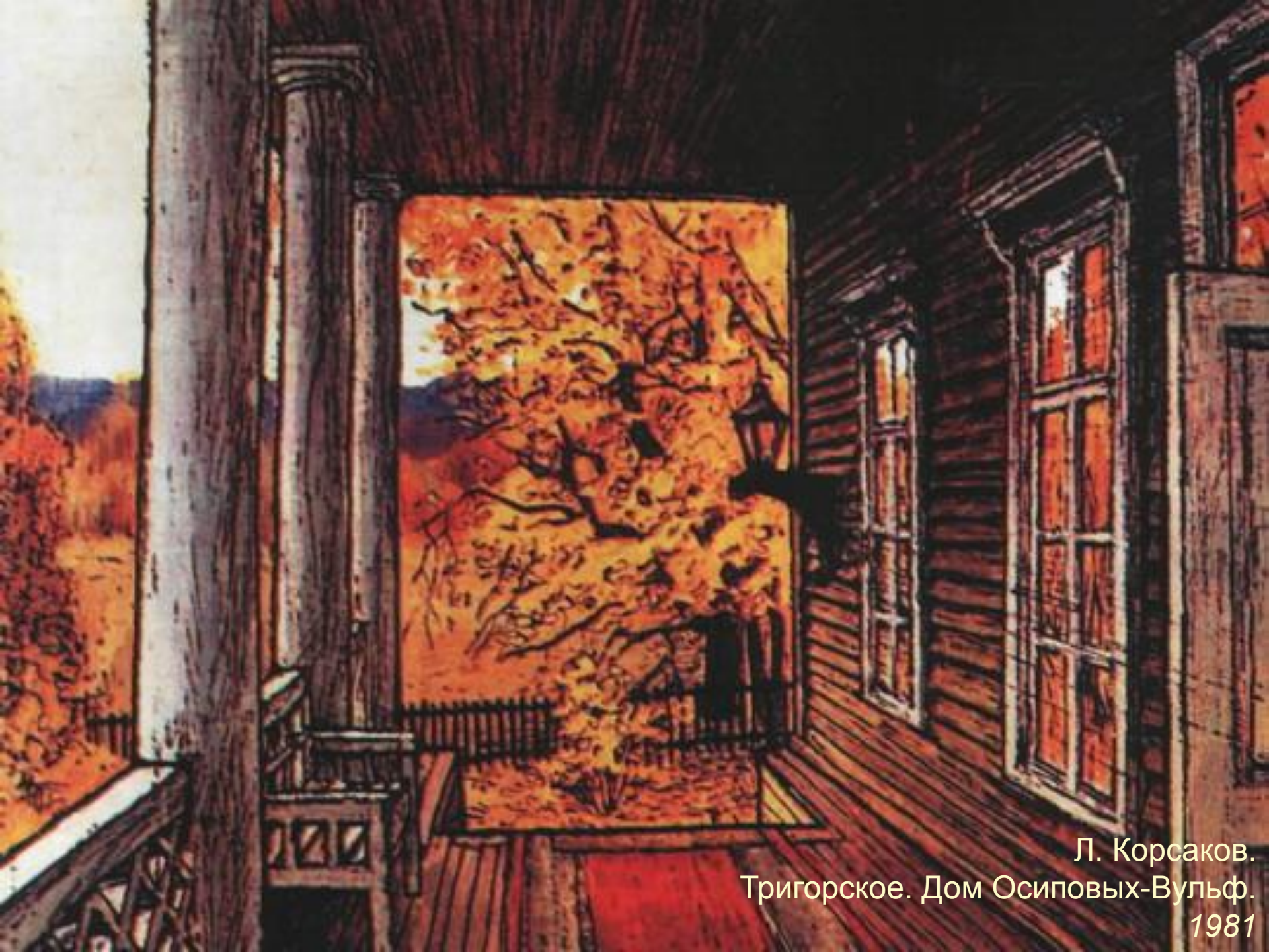
Л. Корсаков. Тригорское. Дом Осиповых-Вульф. 1981