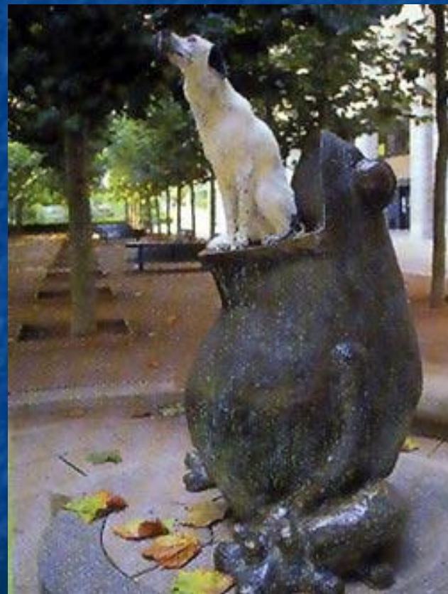
Памятник лягушке возле здания Института Пастера в Париже.