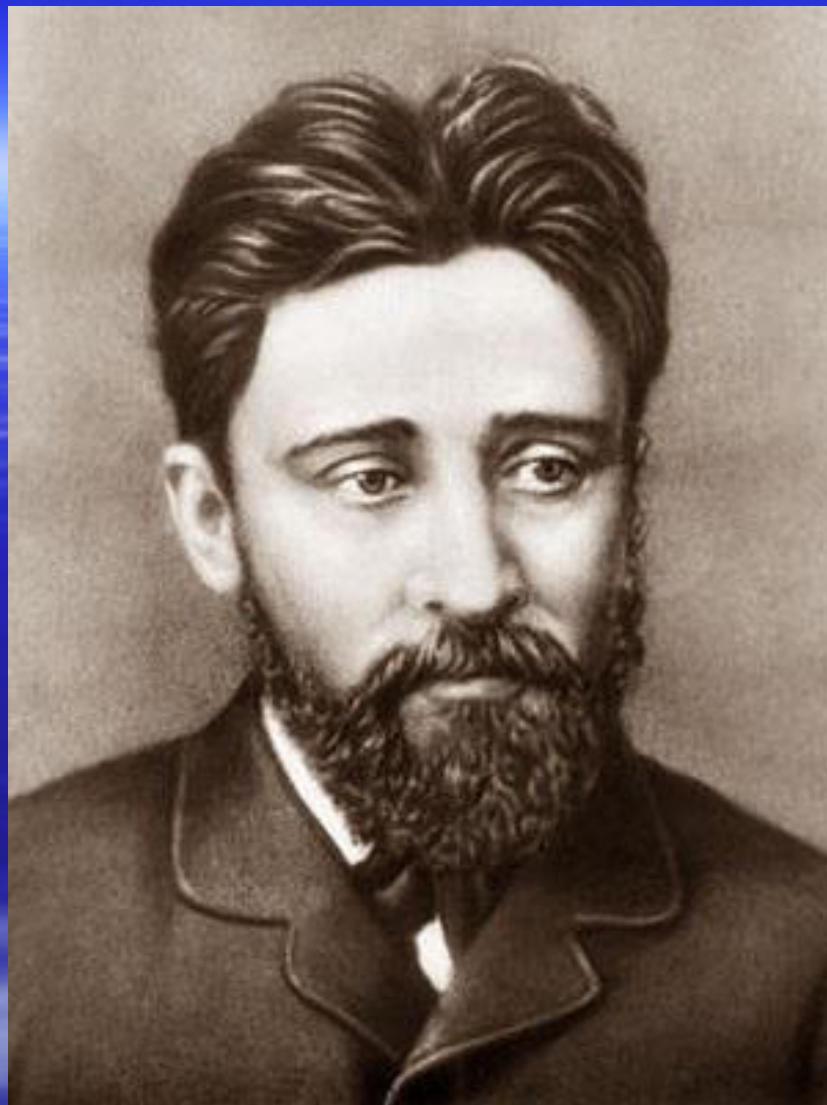
В.М. Гаршин (1855-1888)