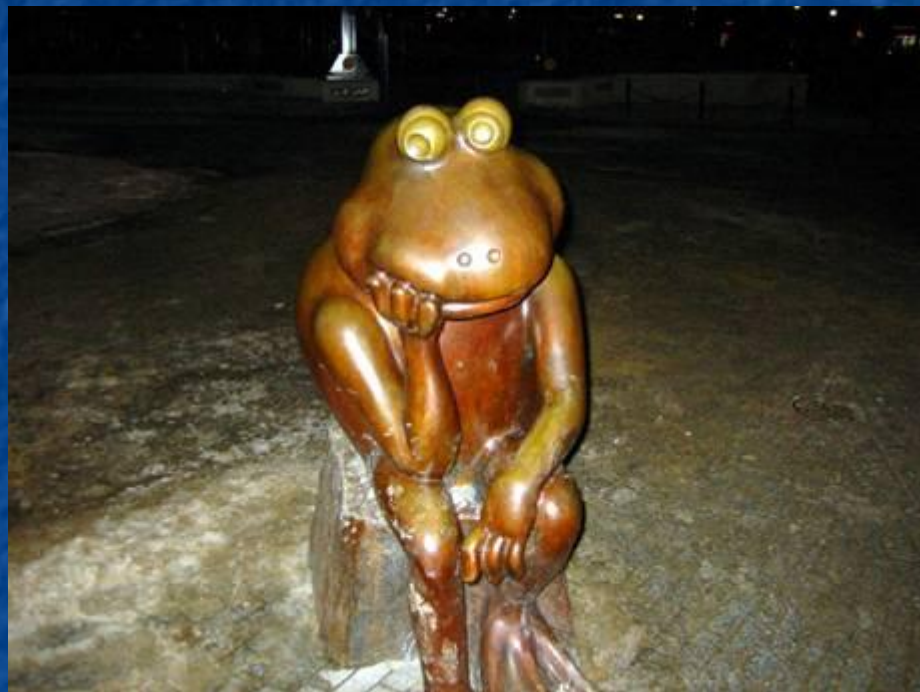
Памятник лягушке в Бостоне