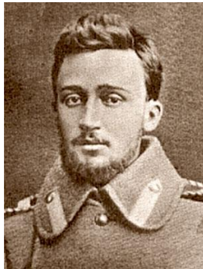
Гаршин в годы войны

В. М. Гаршин не прошел войну до конца, так как, получив ранение в ногу, а после выздоровления получил ранг офицера и закончил свою военную карьеру.