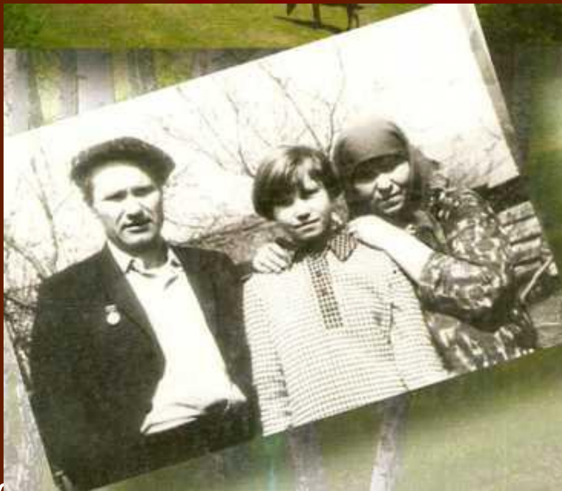
В.М.Шукшин с матерью и племянницей Гадей во дворе. 1966 г.