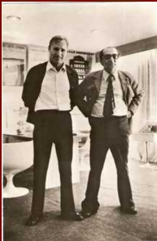
В.М.Шукшин и Г.А.Товстоногов. 1974 г.