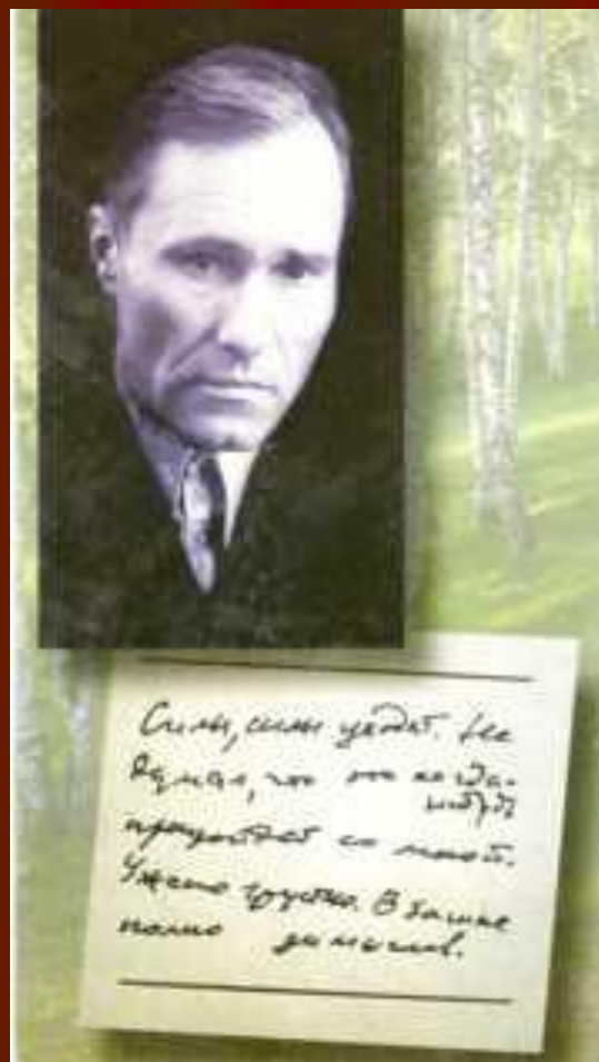
Последний портрет В.М.Шукшина