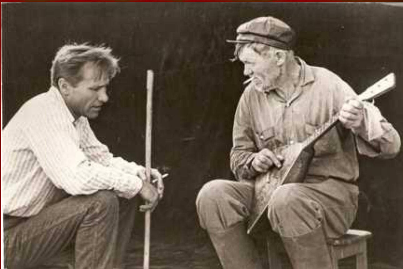
В.М.Шукшин на съёмках фильма «Печки-лавочки». 1972 г.