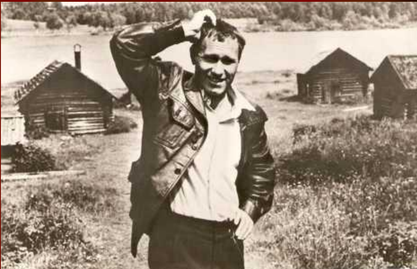
В.М.Шукшин в перерыве между съёмками фильма «Калина красная». 1973 г.