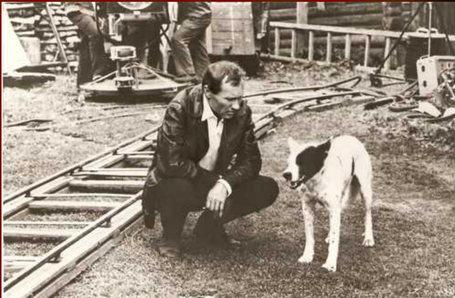
На съёмках фильма «Калина красная». 1973 г.