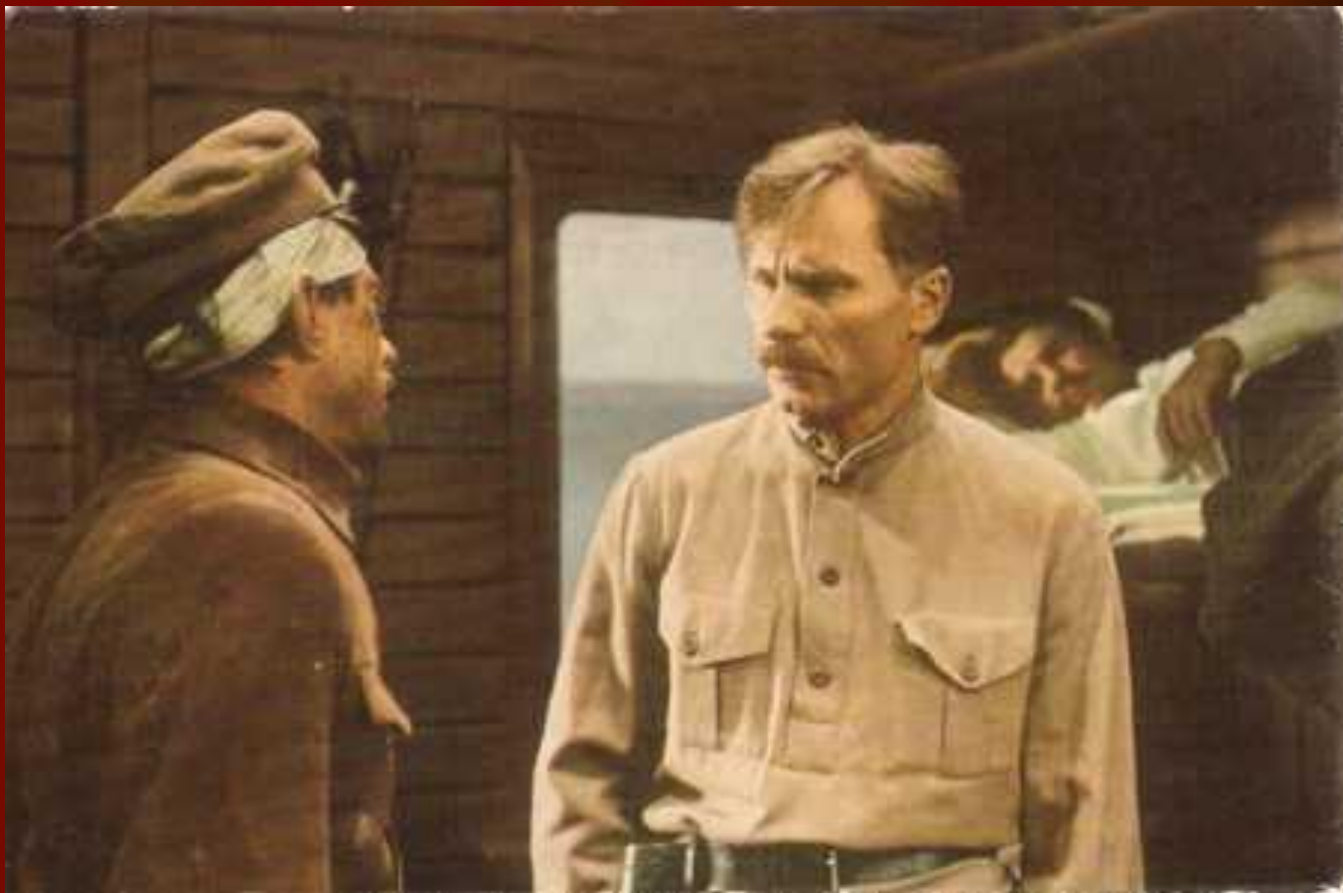
В.шукшин в роли Василия улыбина в фильме «Даурия». 1972 г.