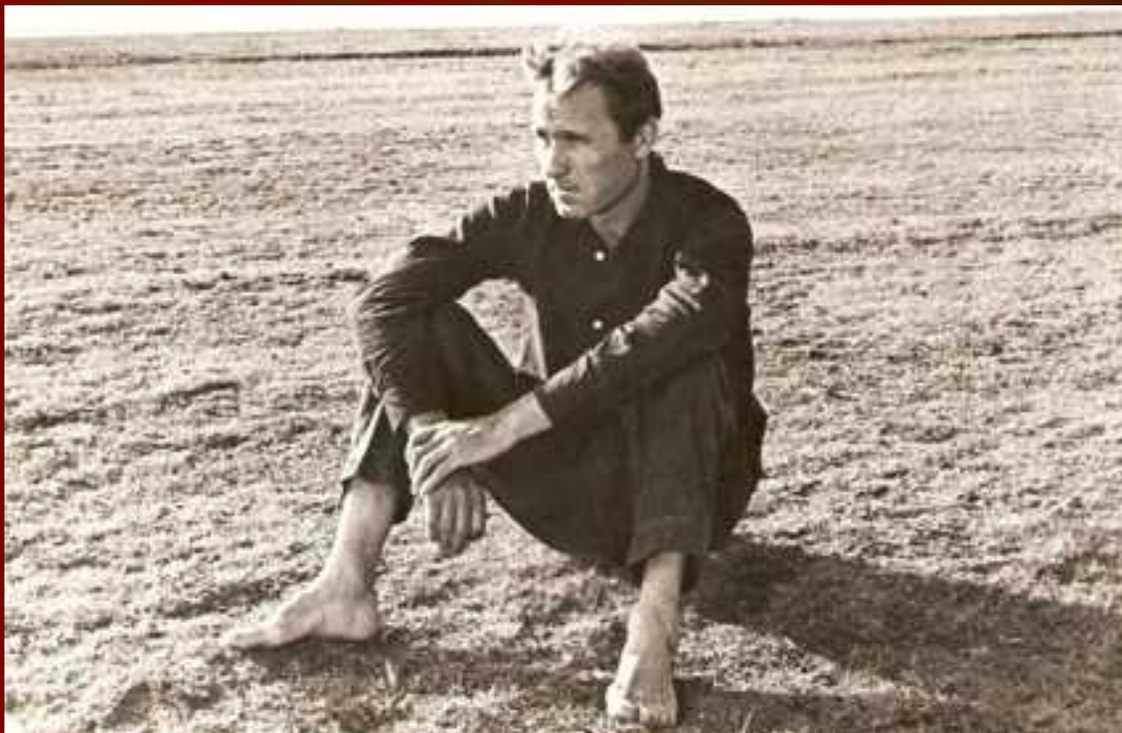
В.М.Шукшин в роли Ивана Расторгуева в фильме «Печки-лавочки». Село Сростки. 1971 г.