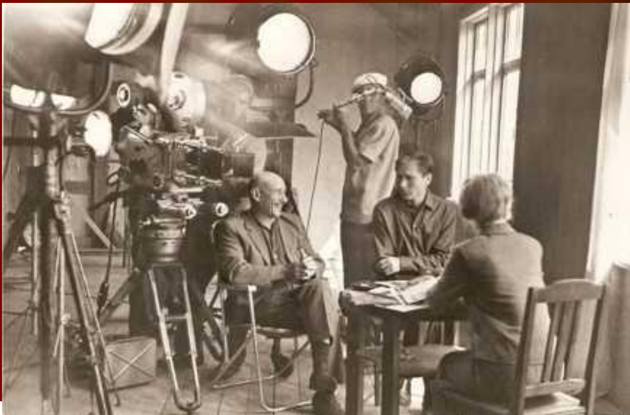
В.М. Шукшин и С.А. Герасимов на съемках фильма «У озера». Москва. 1969 г.