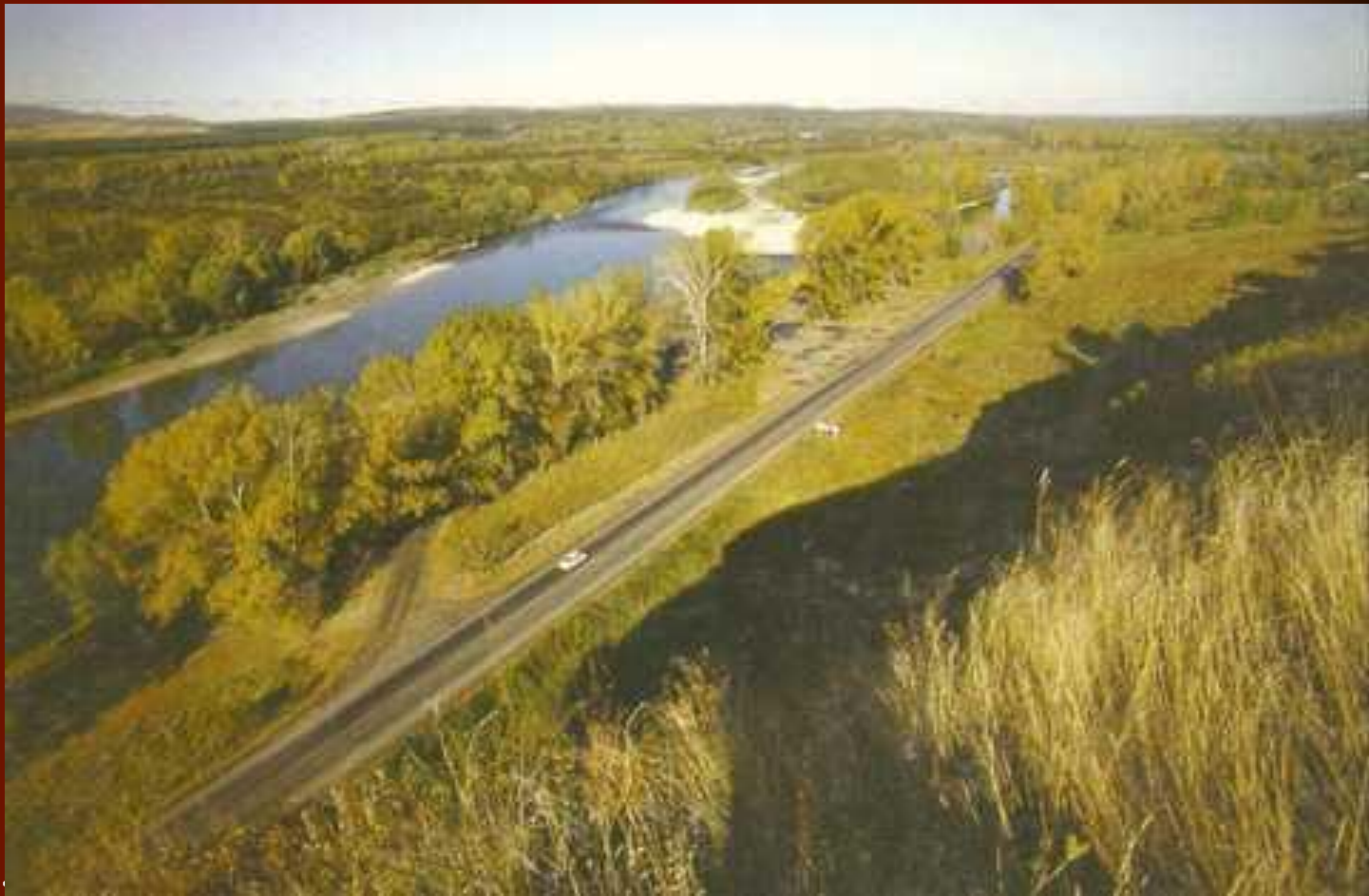
Тульский тракт до петровской границы