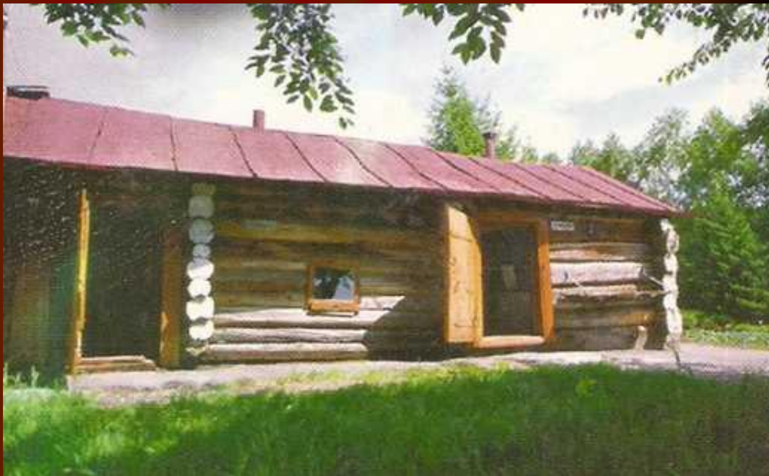
Баня, надворные постройки