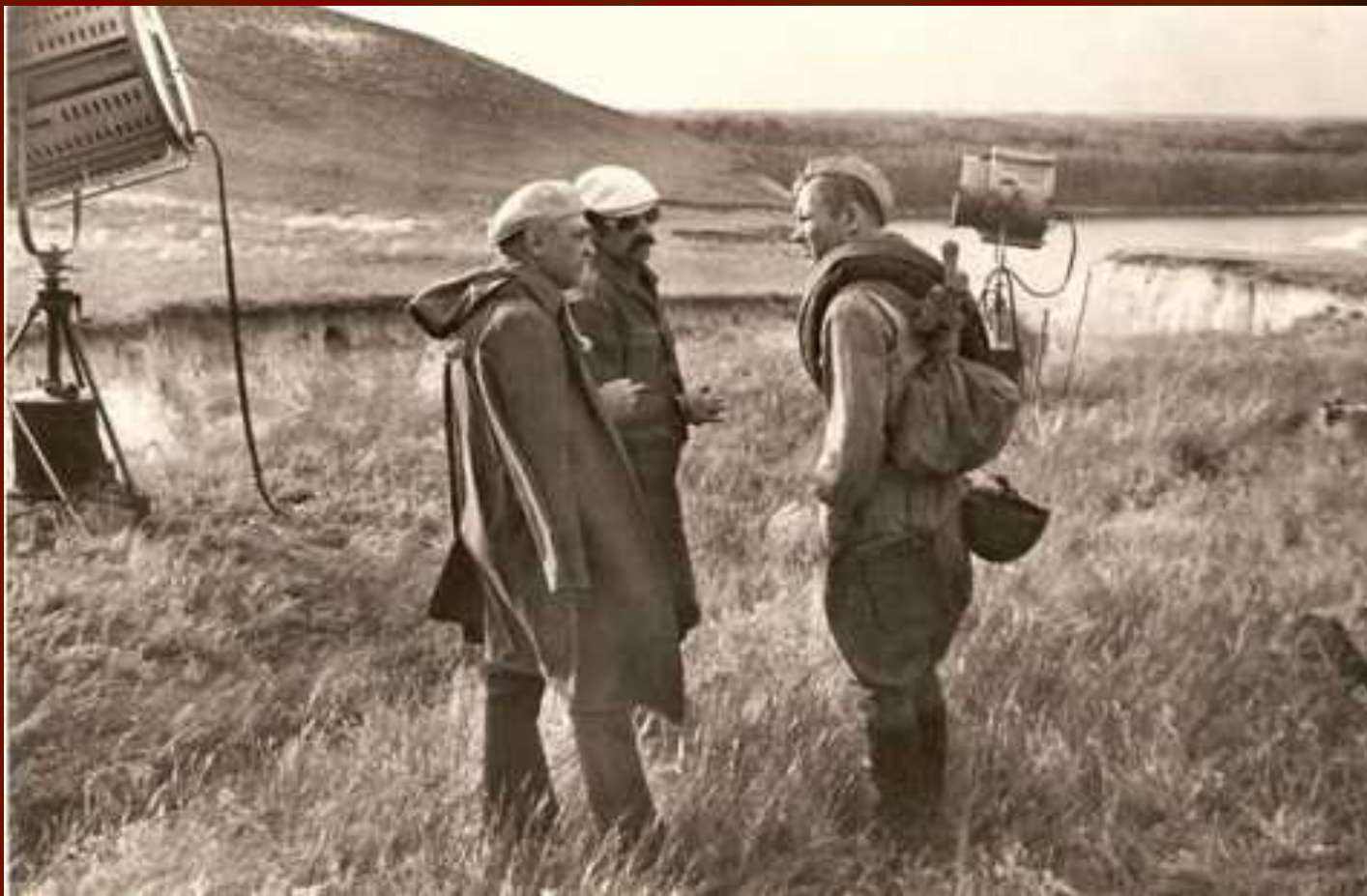
На съемках фильма «Они сражались за Родину». 1973 г.