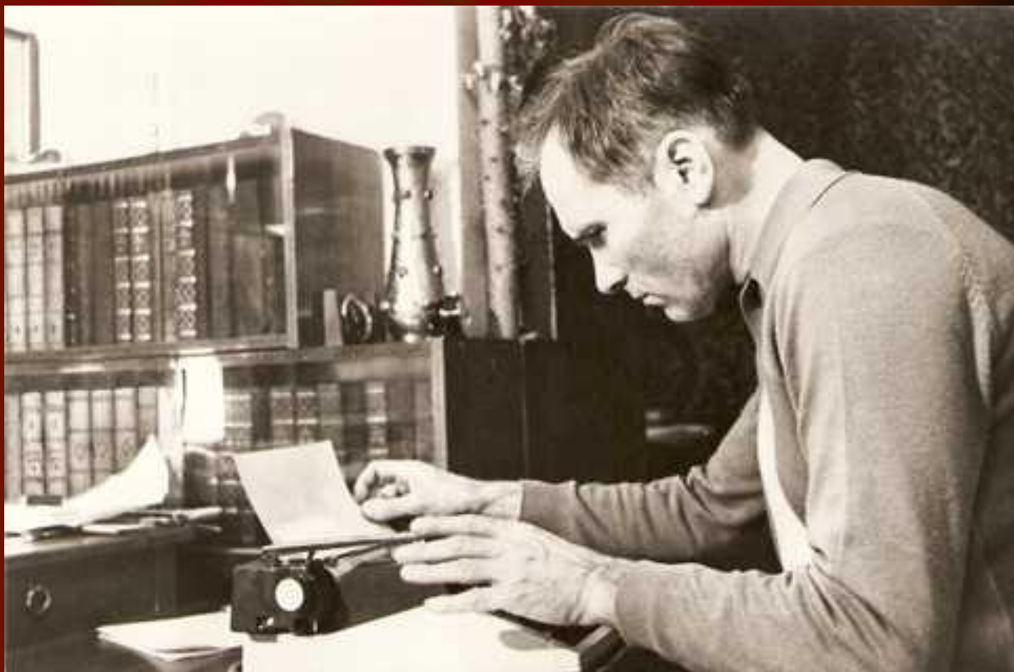
Шукшин за работой. 1974 г.