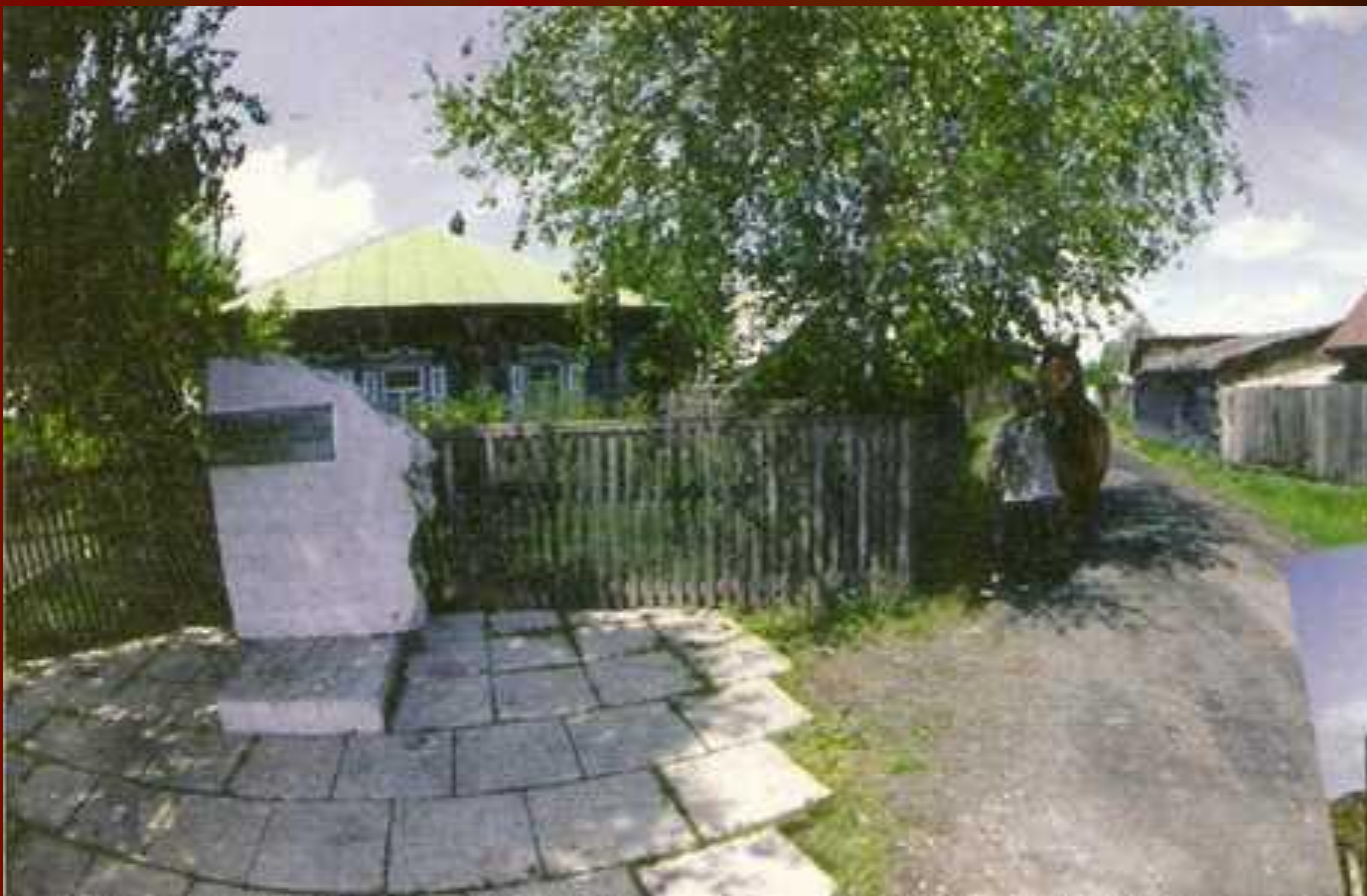
Дом, где прошли детские и юношеские годы В.М. Шукшина