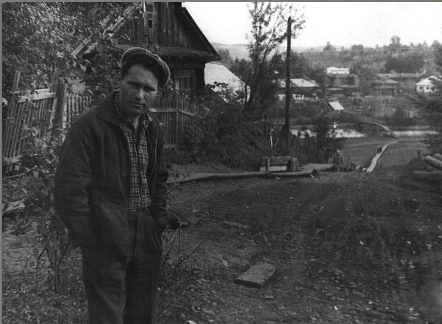
На съемках фильма в с. Сростки Алтайского края 1964 г.