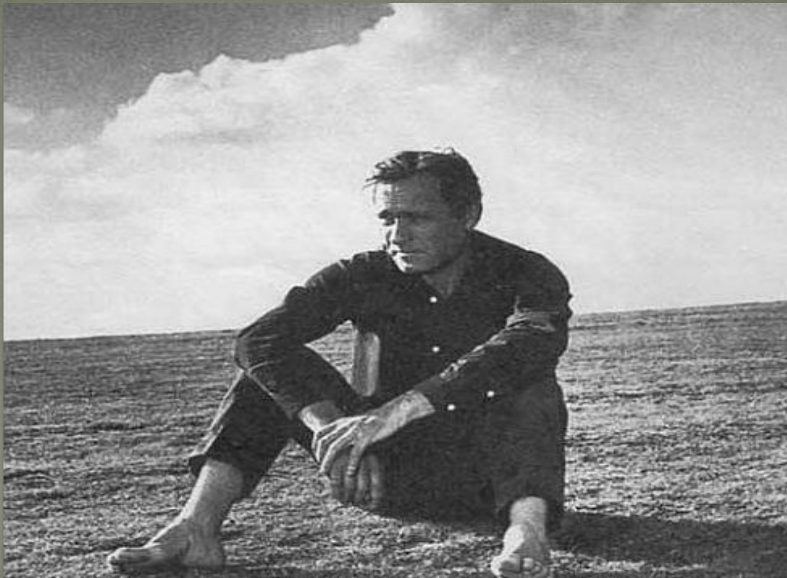
Финальный кадр из фильма «Печки – лавочки»