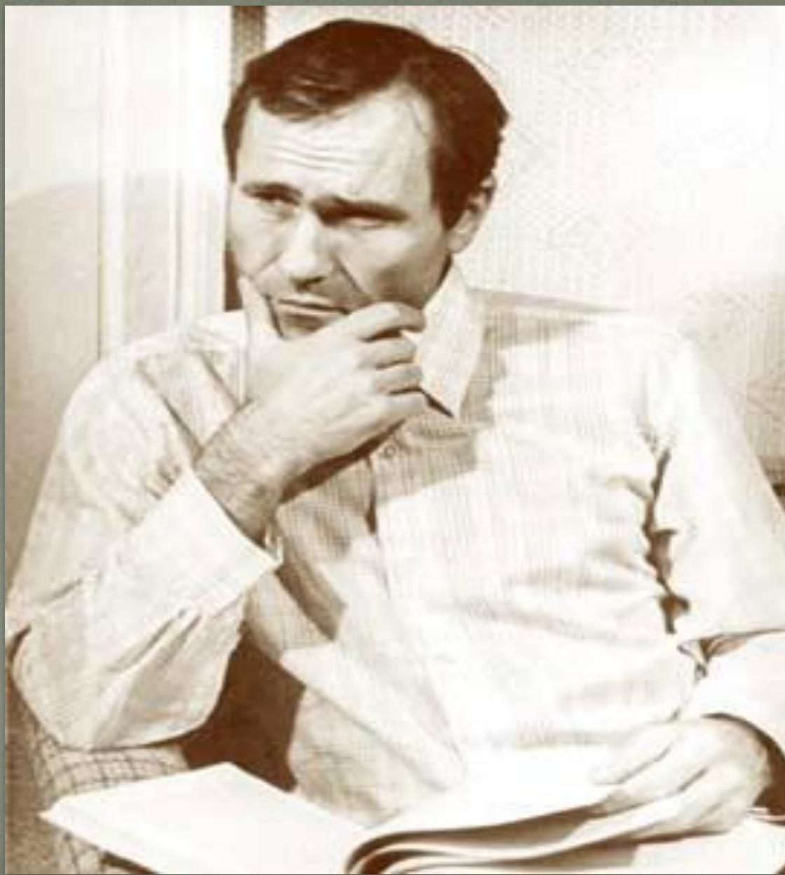
В. М. Шукшин 1929 – 1974 г.