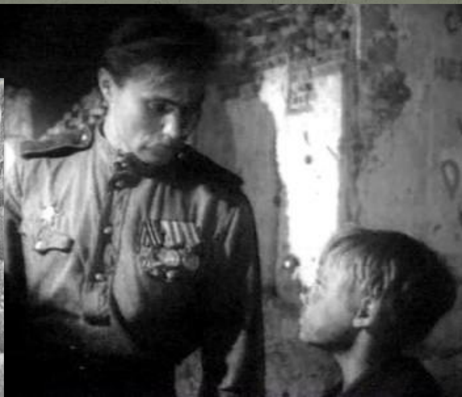
Кадр из фильма «Два Федора» 1964 г.