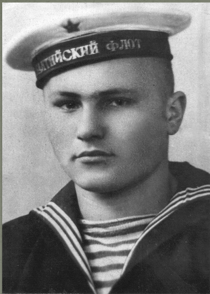
В. Шукшин во время службы на Черноморском флоте 1949 г.