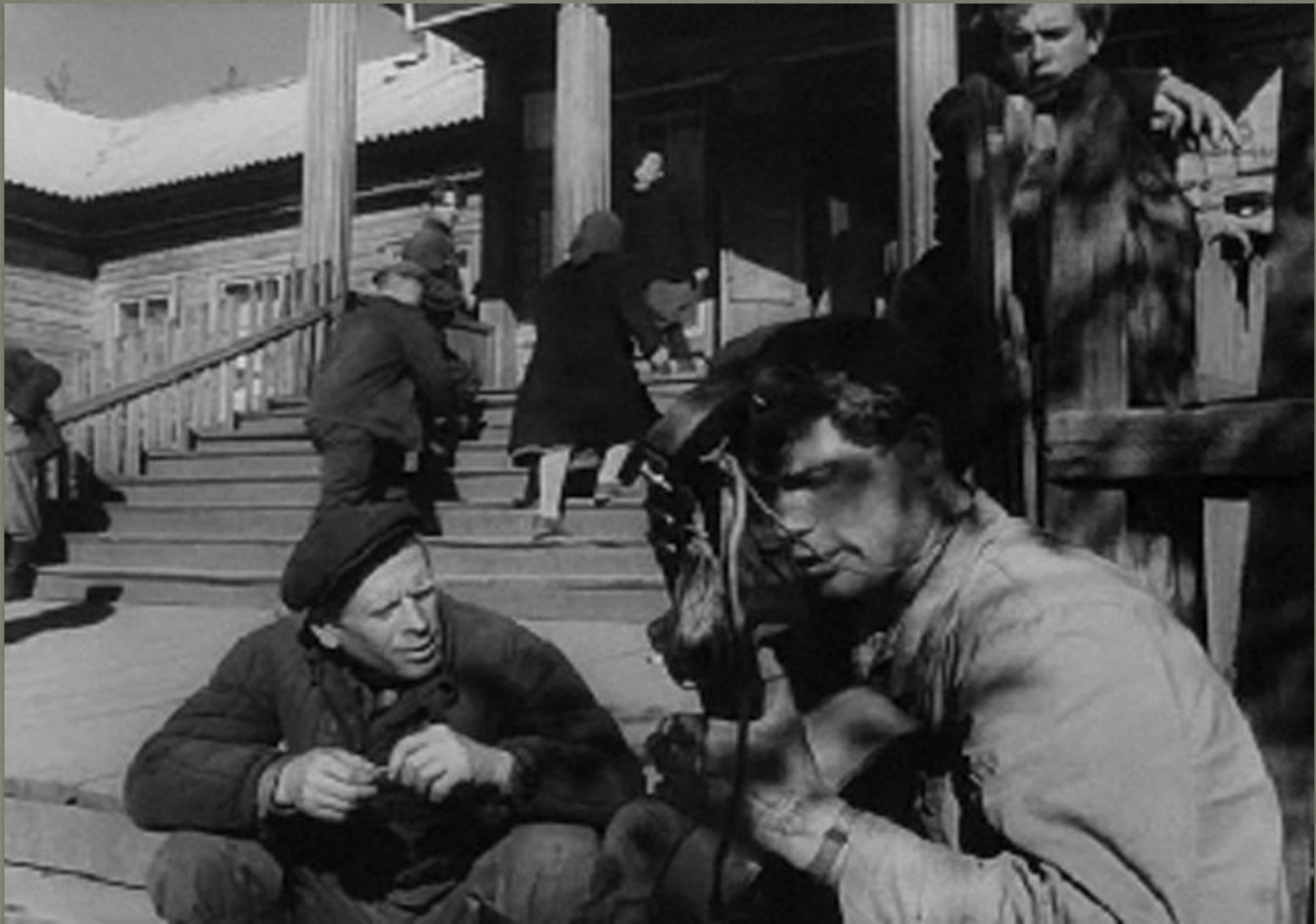
Кадр из фильма «Живет такой парень»