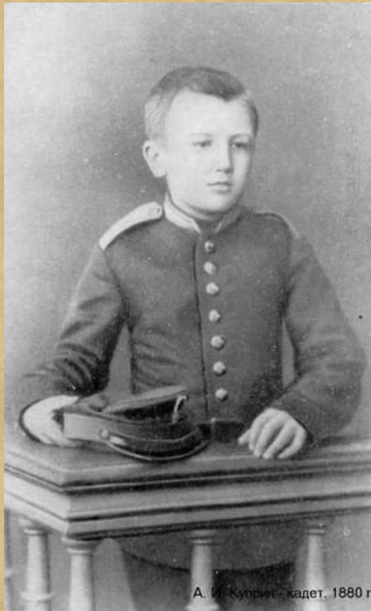
А. И. Куприн - кадет. 1880 г