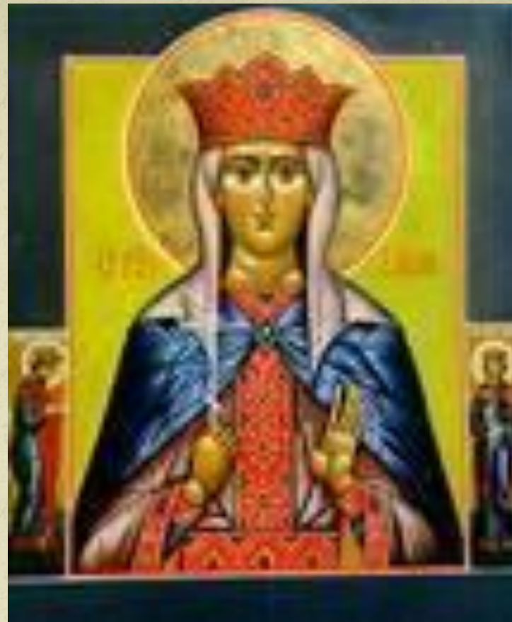
Святая Великомученица Елена