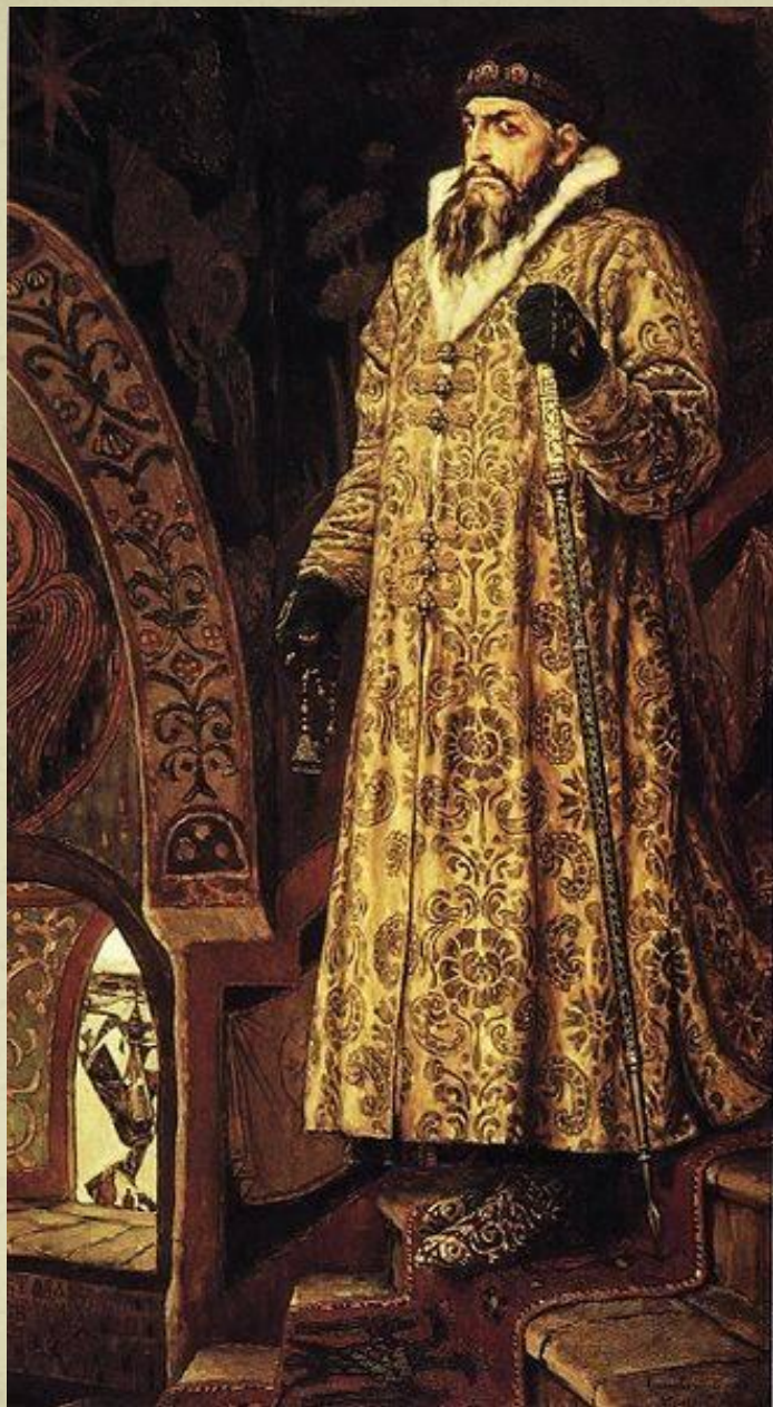
В.М.Васнецов. «Царь Иван Грозный» (1530-1584)