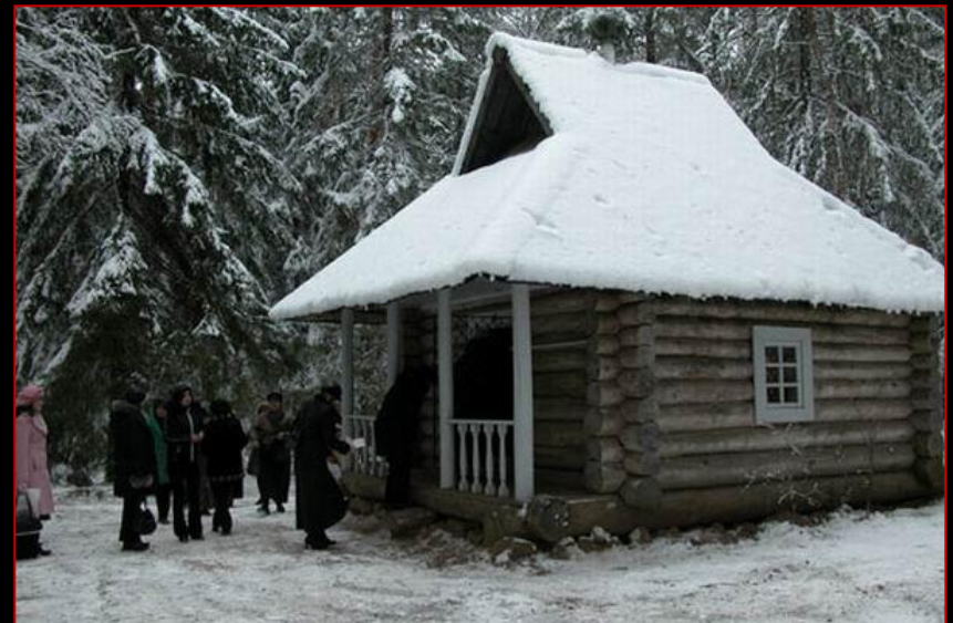
ДОМИК НЯНИ ПОЭТА