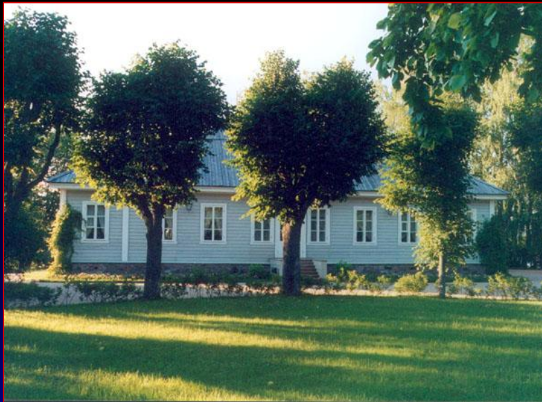
МИХАЙЛОВСКОЕ. ДОМ ПОЭТА.