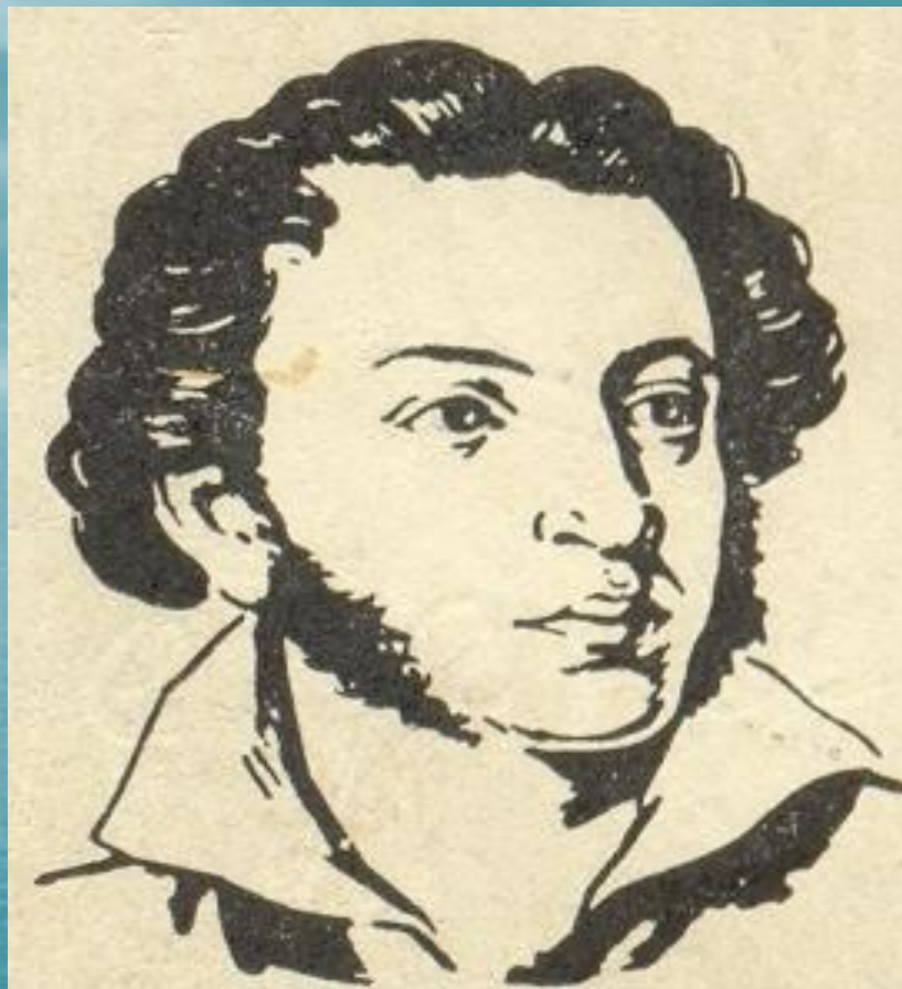
Александр Сергеевич Пушкин