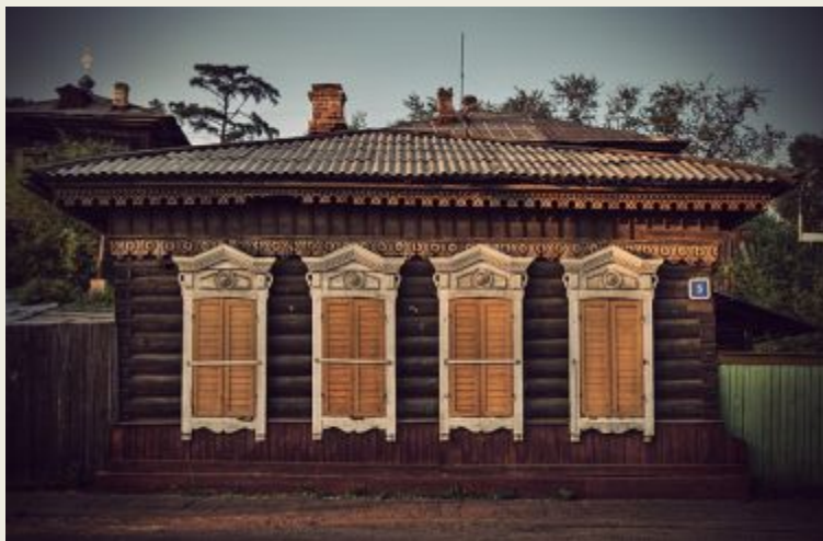
Окна дома закрыты ставнями

Что такое « ставни » – деревянный затвор, ставни » на окнах в деревянных домах.