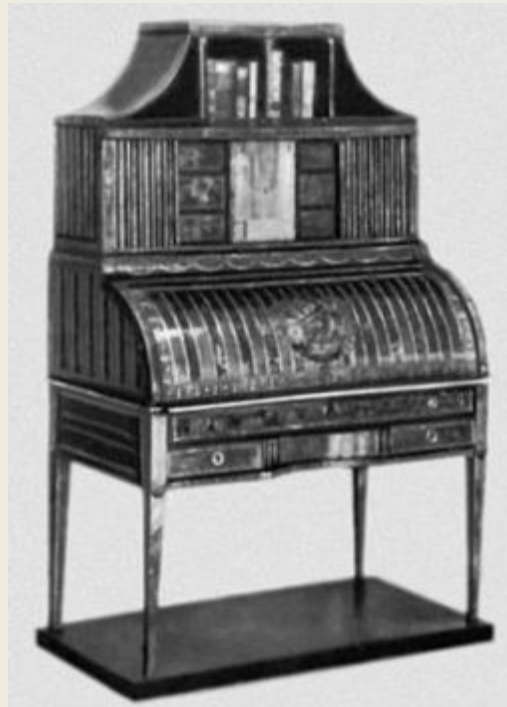
Бюро наборного дерева. Россия. Последняя четверть 18 в. Исторический музей. Москва.

вид стола с ящиками и отделениями для хранения бумаг.