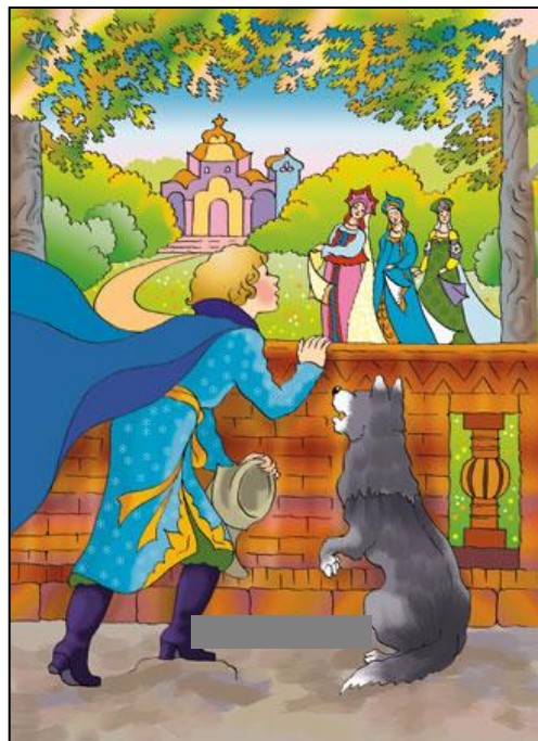
Иван царевич и серый волк