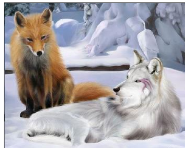
Волк и лиса