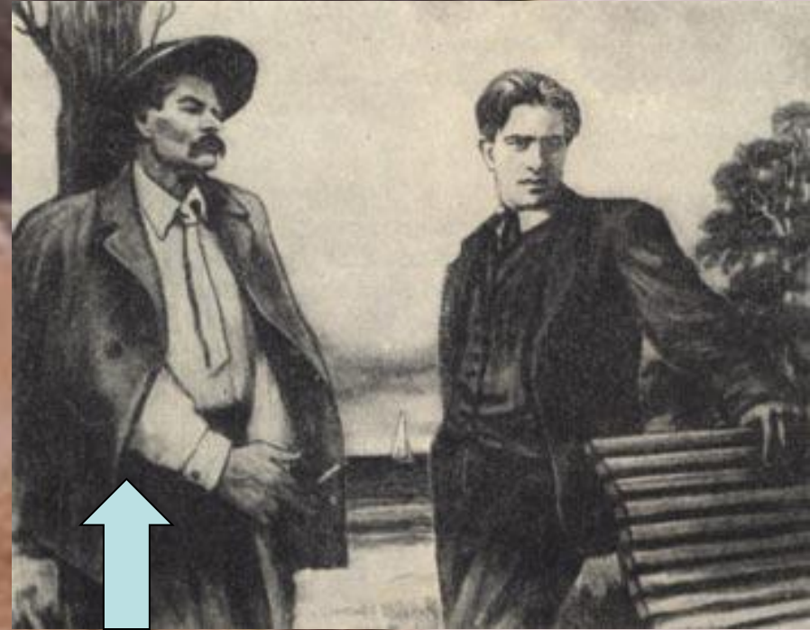
Володимир Маяковський і Максим Горький у Фінляндії