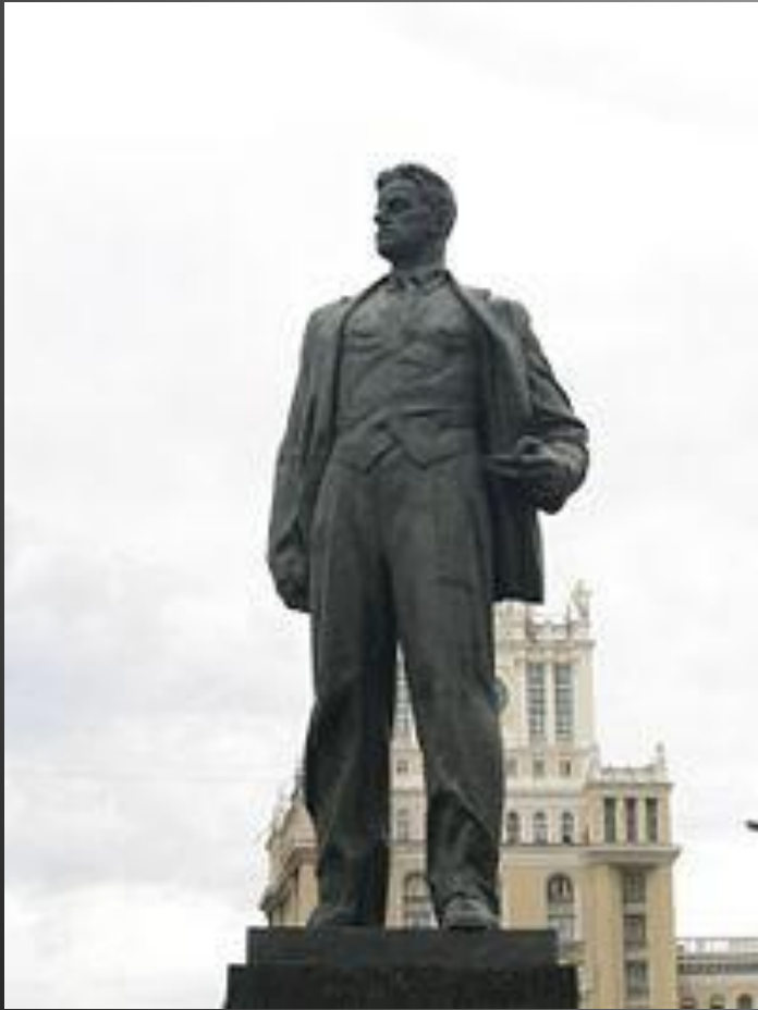
Пам'ятник на площі Маяковського у Москві