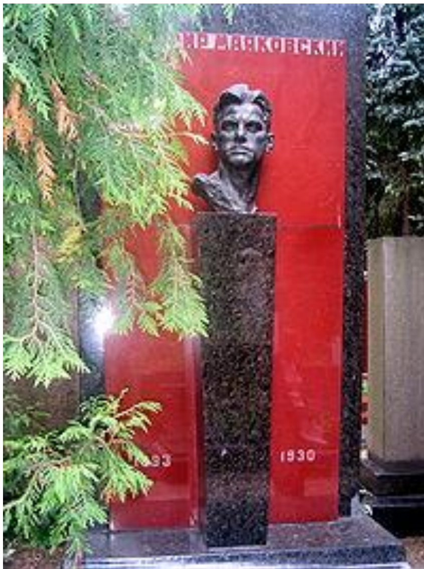
Пам'ятник поету на Новодівичому цвинтарі