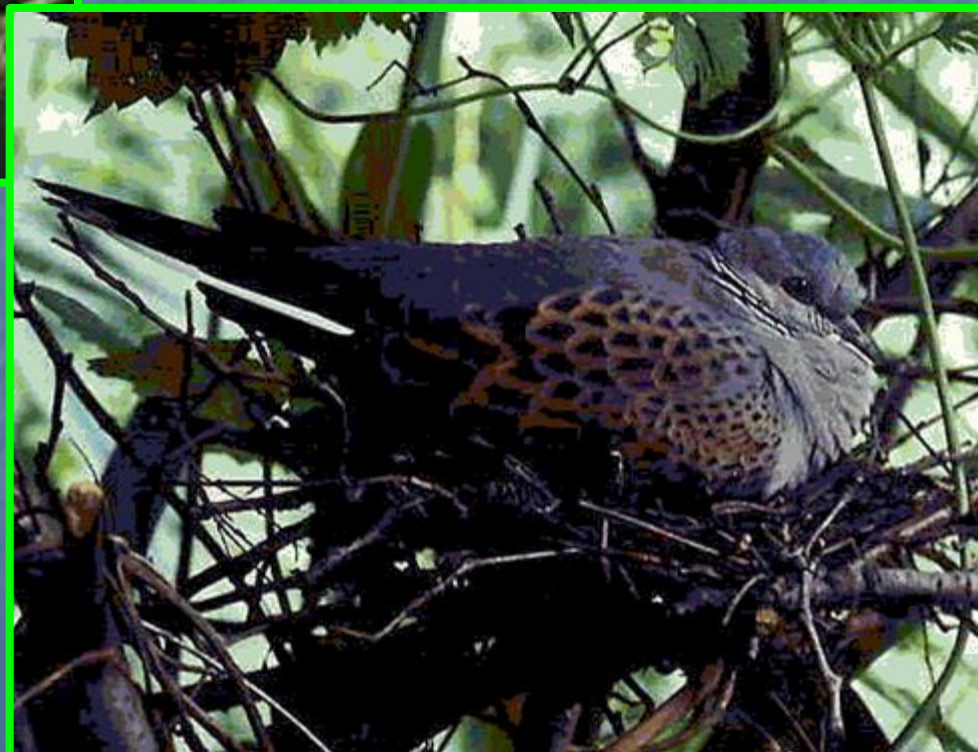
Горлица на гнезде