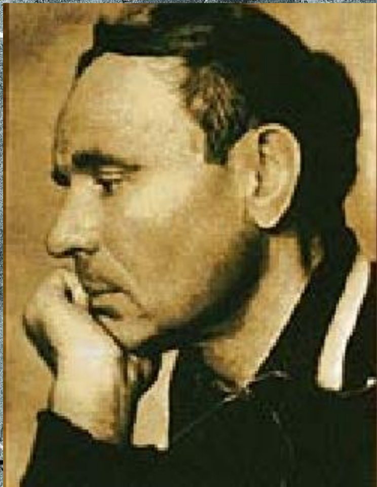
Воробьев Константин Дмитриевич (1919–1975)

Родился 24 сентября 1919 в с. Нижний Реутец Курской области. Окончил сельскую школу-семилетку, курсы киномехаников.