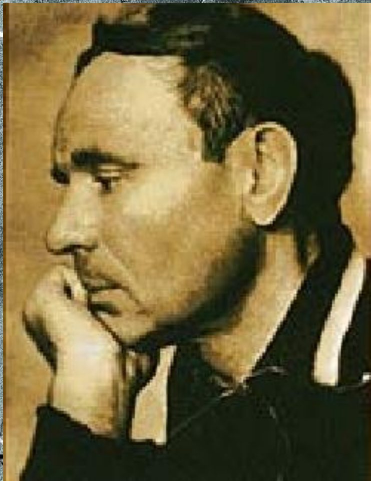
Воробьев Константин Дмитриевич (1919–1975)

Родился 24 сентября 1919 в с. Нижний Реутец Курской области. Окончил сельскую школу-семилетку, курсы киномехаников.