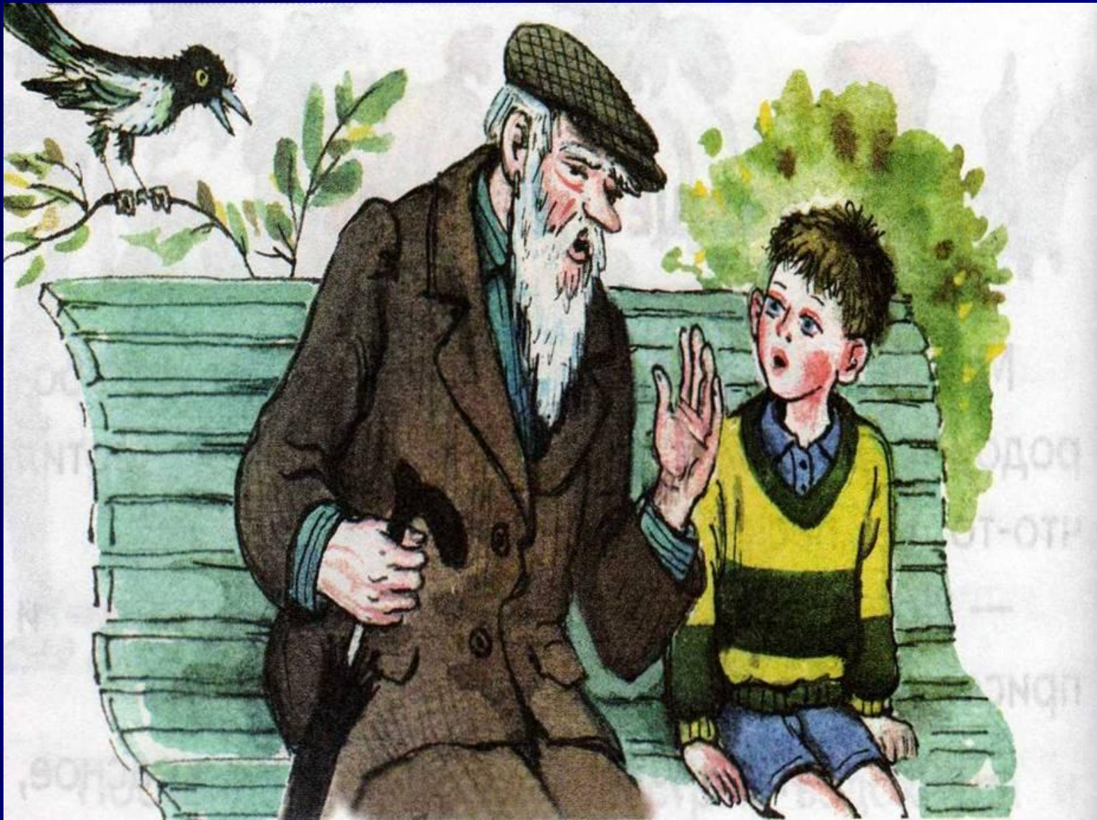
В.Осеева «Волшебное слово»