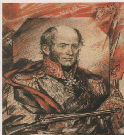
Михаил Богданович Барклай де Толли 1761—1818