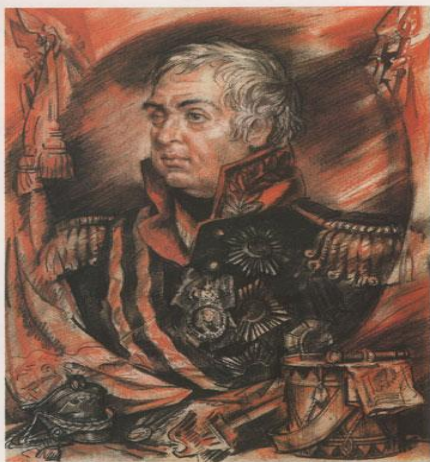
Михаил Илларионович Кутузов 1745—1813