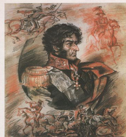
Петр Иванович Багратион 1765—1812