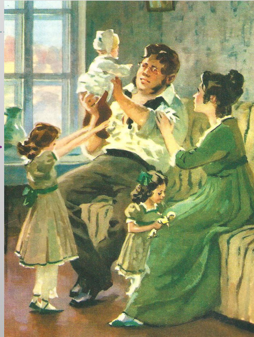
А. В. Николаев. Семья Безуховых.

Для Толстого, писателя и человека, истинная красота – в душевной наполненности, а глаза отражают работу души.