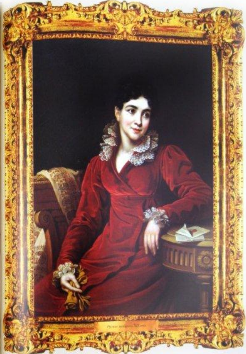
Рисунки автора. 1827 год