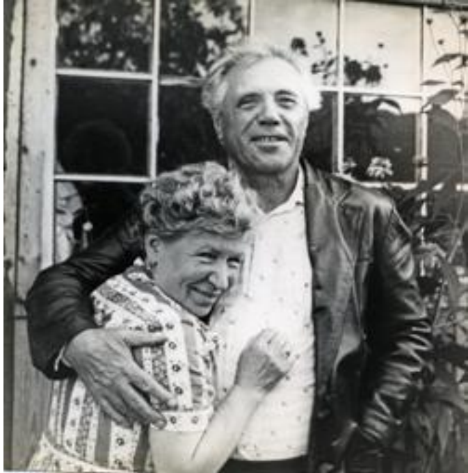
Вместе с женой