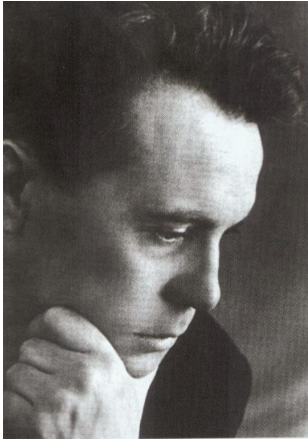
Астафьев в молодые годы

Учитель школы-интерната сибирский поэт Игнатий Дмитриевич Рождественский замечает в Викторе склонность к литературе и развивает ее. Сочинение о любимом озере, напечатанное в школьном журнале, развернется позднее в рассказ "Васюткино озеро". Окончив школу-интернат, подросток зарабатывает себе на хлеб в станке Курейка. "Детство мое осталось в далеком Заполярье, - напишет спустя годы В. П. Астафьев. - Дитя, по выражению деда Павла, "не рожено, не прошено, папой с мамой брошено", тоже куда-то девалось, точнее - откатилось от меня. Чужой себе и всем, подросток или юноша вступал во взрослую трудовую жизнь военной поры". Собрав денег на билет. Виктор уезжает к Красноярск, поступает и ФЗО. "Группу и профессию в ФЗО я не выбирал -- они сами меня выбрали", расскажет впоследствии писатель. Окончив учебу, он работает составителем поездов на станции Базаиха под Красноярском.