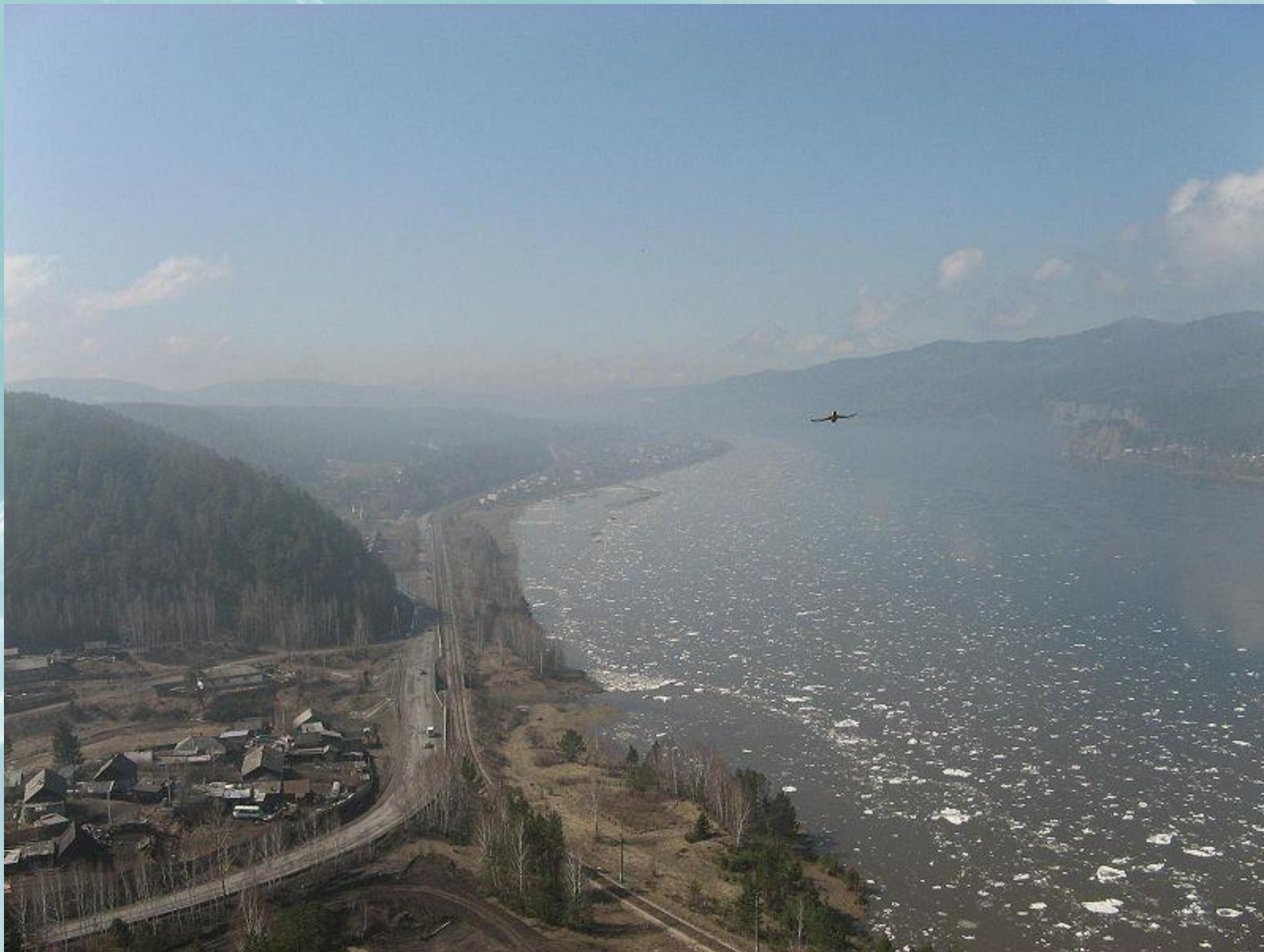
Овсянка — родное село писателя