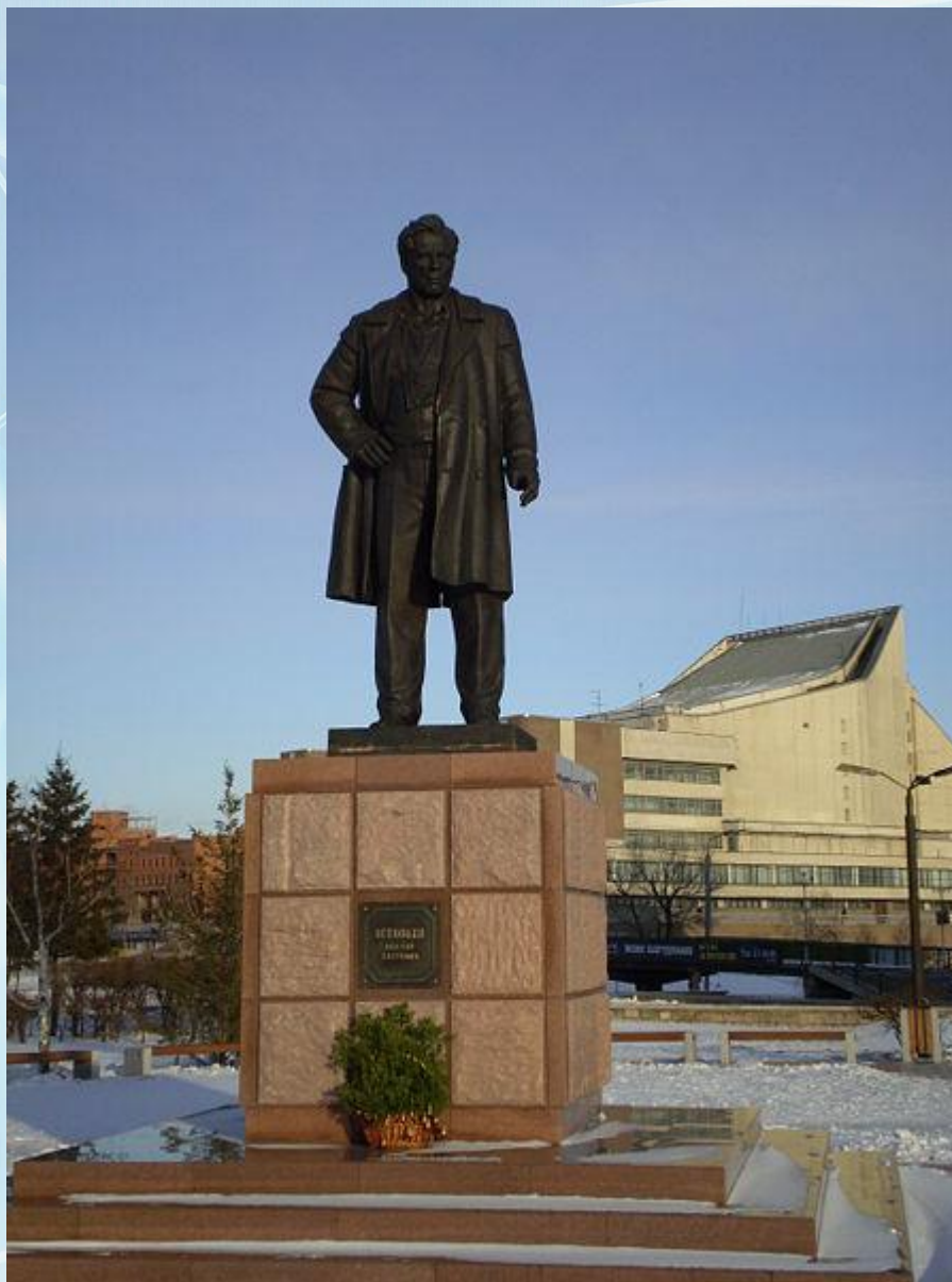
Памятник В. П. Астафьеву в Красноярске (2006). Скульптор Игорь Линеви́ч-Яворский