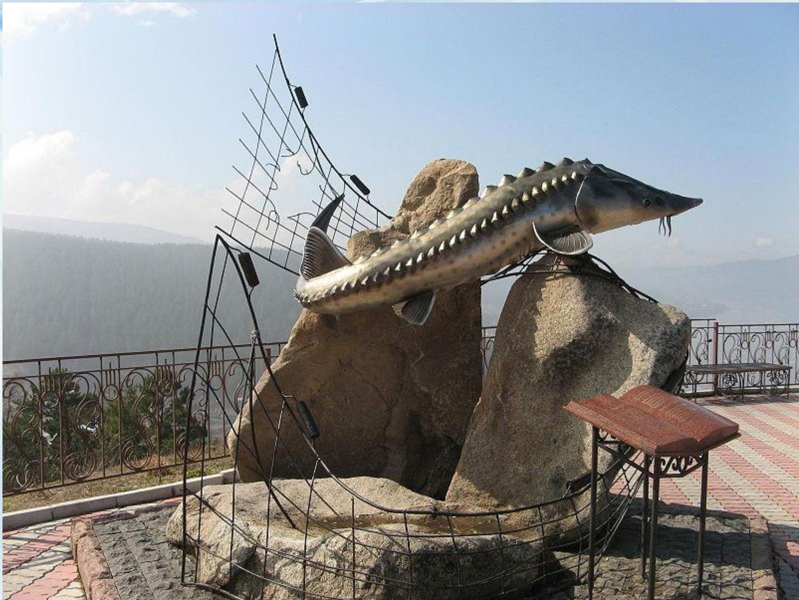
Памятник писателю возле автодороги Красноярск—Абакан