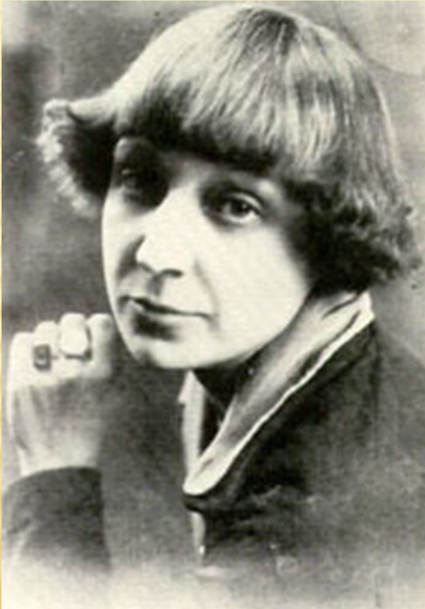
Марина Ивановна Цветаева (1892 – 1941)