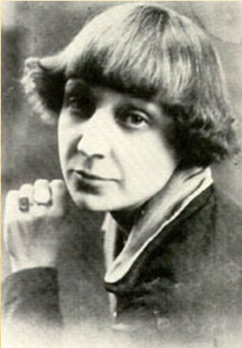
Марина Ивановна Цветаева (1892 – 1941)