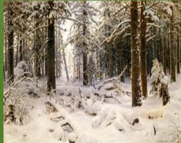
И. Шишкин. «Зима»