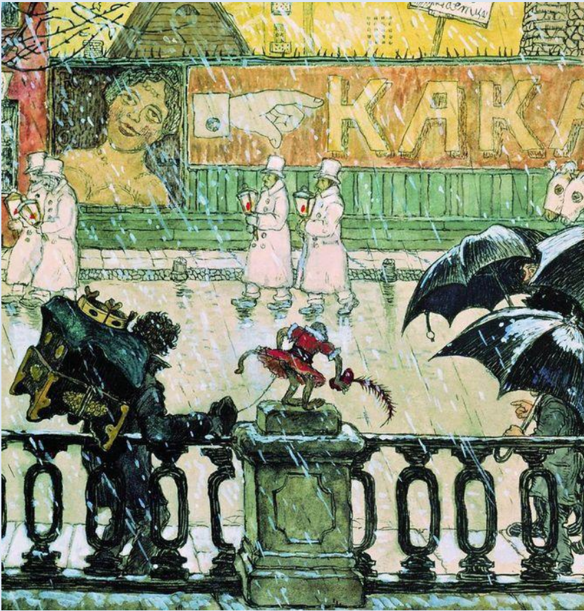
М.В. Добужинский. Grimасы города. 1908 год. Бумага, акварель, гуашь. Третьяковская галерея.