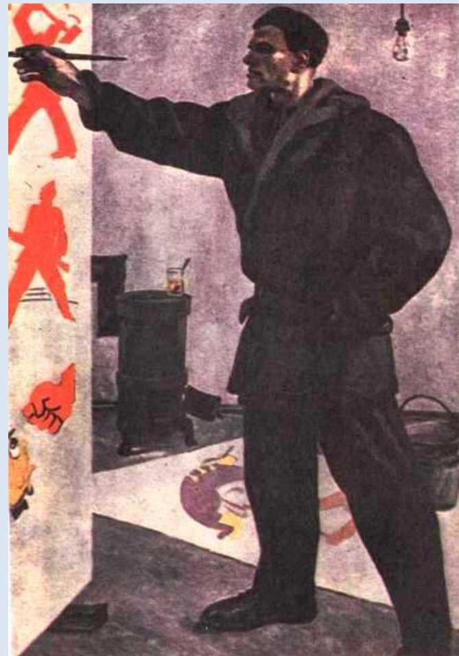
Маяковский в мастерской РОСТА. 1941 г.