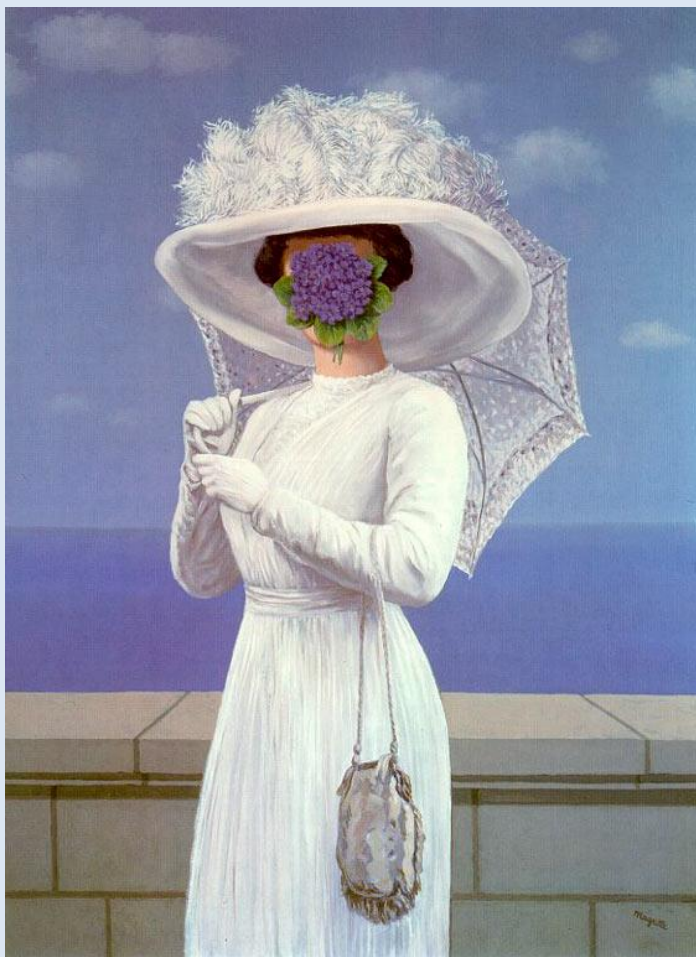
Рене Магритт. Великая война