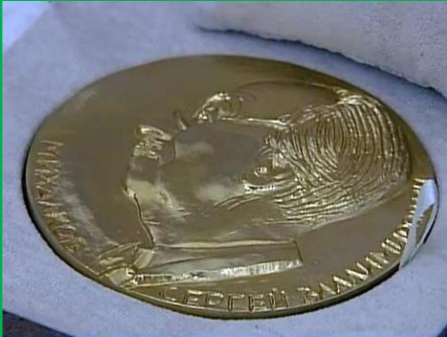
Памятная Золотая медаль имени Сергея Михалкова