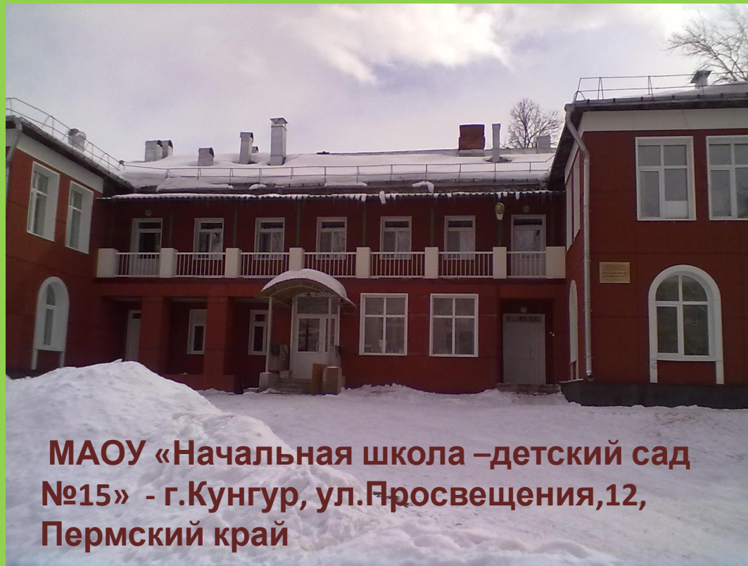
МАОУ «Начальная школа –детский сад №15» - г.Кунгур, ул.Просвещения,12, Пермский край