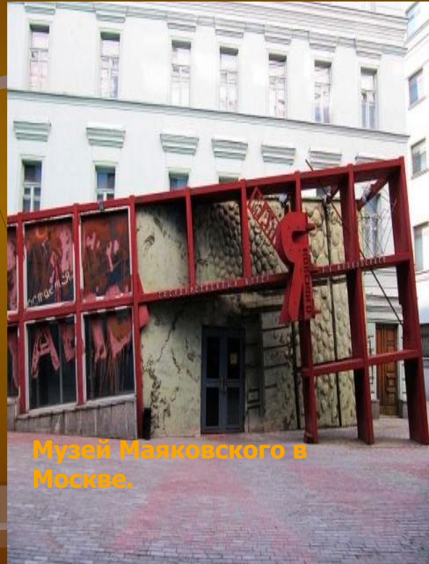
Музей Маяковского в Москве.

Как и с Есениным, самоубийство Маяковского вызвало различную реакцию и множество версий. Одной из мишеней стала 22-летняя актриса МХАТа Вероника Полонская. Известно, что Маяковский просил ее стать женой. Именно она была последним человеком, видевшим поэта живым. Однако показания актрисы, соседей по квартире и данные следствия свидетельствуют, что выстрел прогремел сразу после того, как Полонская вышла из комнаты Маяковского. Значит, стрелять она не могла.