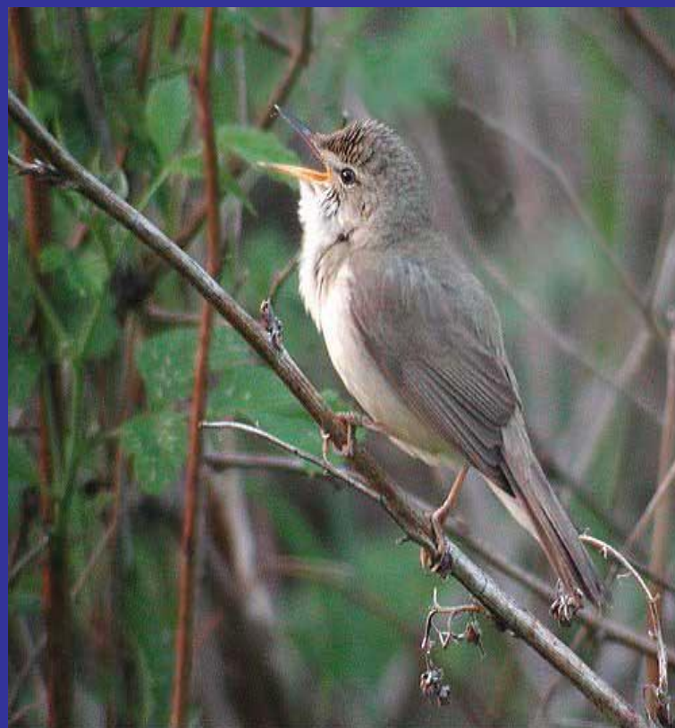
Камышевка садовая - Acrocephalus dumetorum

1. Дедушка увидел птицу-неслышимку над ручьём на вершине ольхи.