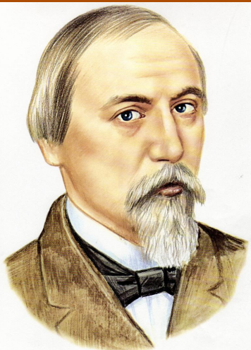
Некрасов Николай Алексеевич (1821-1877)