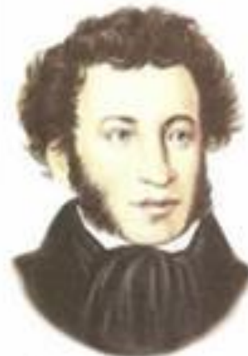
Долгоруков Пётр Алексеевич (1770-1837)