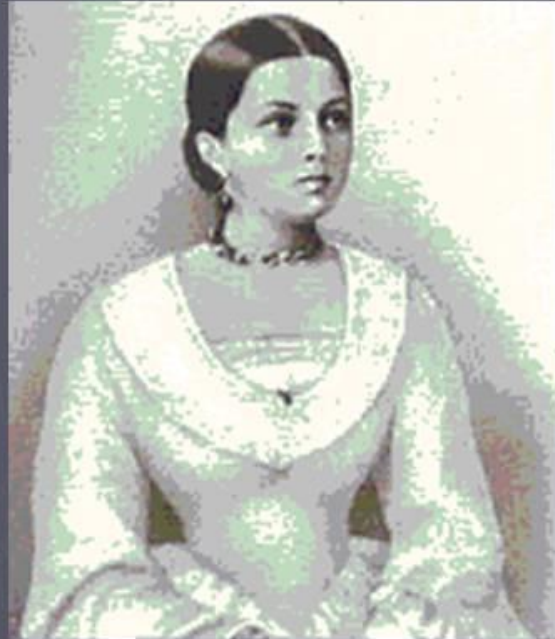
А. Я. Панаева

Драматичной была любовь поэта, связавшая его на долгие годы с Авдотьей Яковлевной Панаевой. Она была его счастьем и мукой, вызвала целую серию любовных стихотворений, известных под названием панаевского цикла. Влюблённые встречаются, ссорятся, мирятся, расстаются. И в этом «романе» утверждается идеал заботливой, ласковой женщины-подруги как опоры в трудной жизненной борьбе, как целительницы поэта, испытывающего творческие и сердечные муки. Стихотворение «Мы с тобой бестолковые люди..» посвящено Панаевой. Любовь в стихах Некрасова согревает человека, помогает выжить в жестоком мире.