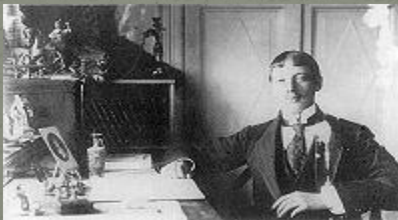
Фотография 1907 года

«Не беспокойся обо мне, я чувствую себя прекрасно, читаю Гомера и пишу стихи». Лаконичная записка, написанная ровным безмятежным почерком. В ней нет ни тени тревоги, ни намёка на какую-либо опасность. А между тем писавший её знал, что жить ему оставалось считанные дни.