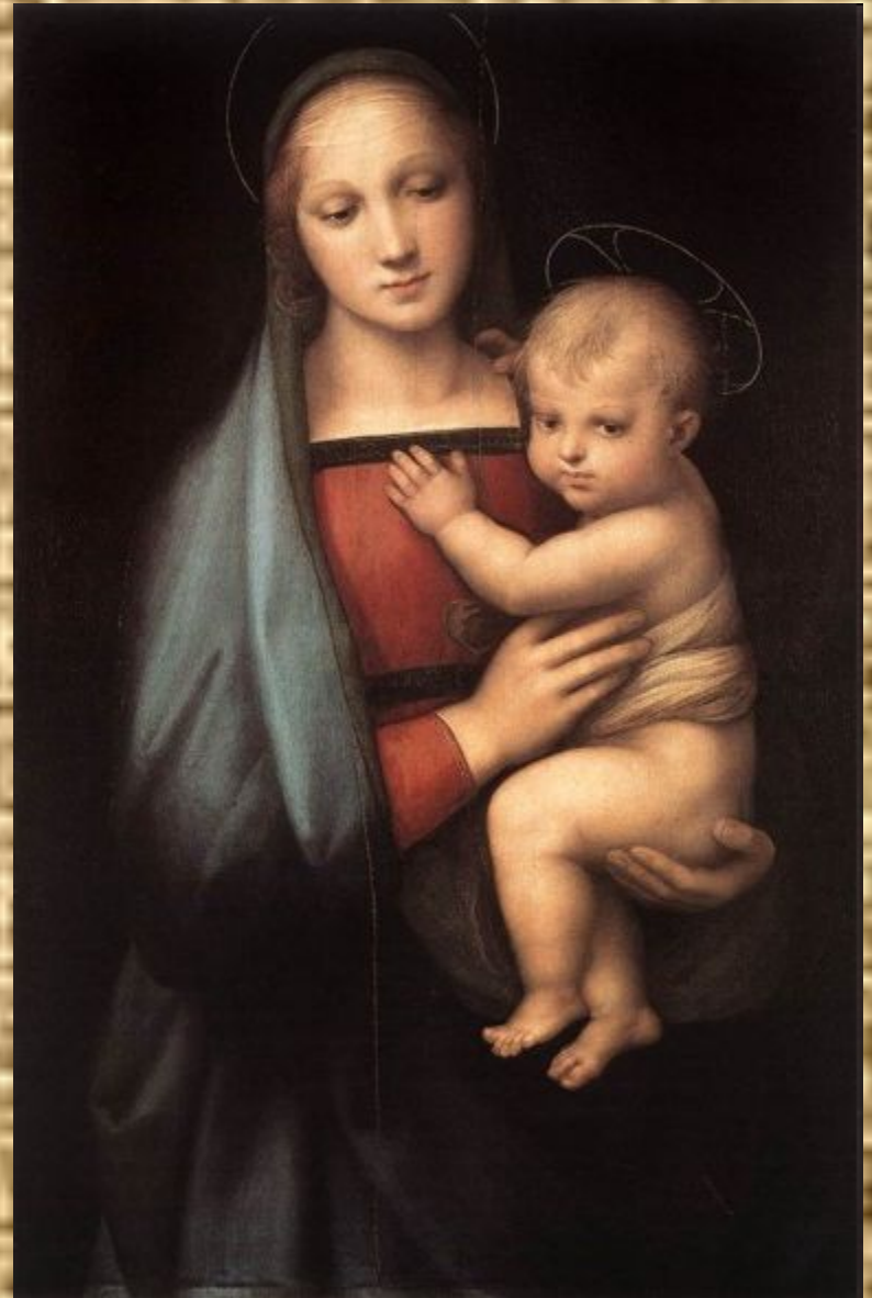
Рафаэль. Мадонна Грандука.

Она с величием, он с разумом в очах - Взирали, кроткие, во славе и в лучах, Одни, без ангелов, под пальмою Сиона.