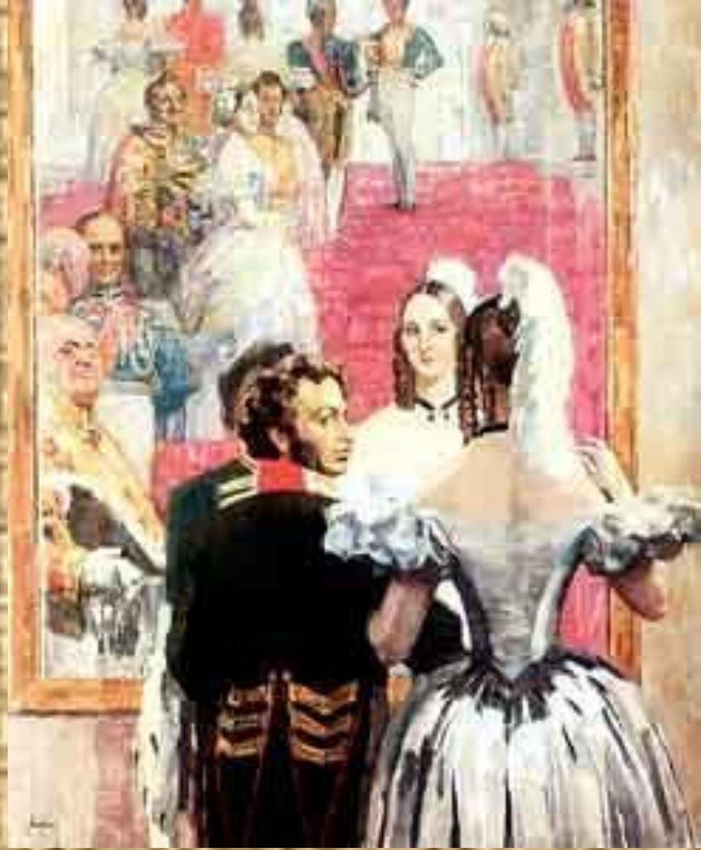
Н. П. Ульянов. Пушкин с женой перед зеркалом на придворном балу. 1936 г.

Вечное безденежье, унизительное, двусмысленное положение: младший придворный чин камер- юнкера и обязанность жить в Петербурге и являться на придворные балы с красавицей женой, невозможность выйти в отставку, что лишало бы поэта возможности работать в исторических архивах.