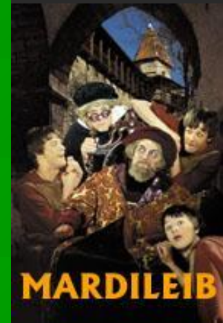
Афиша к недавно поставл- енному спектак- лю по мотивам произв- едения Яана Кросса «Мартов хлеб»