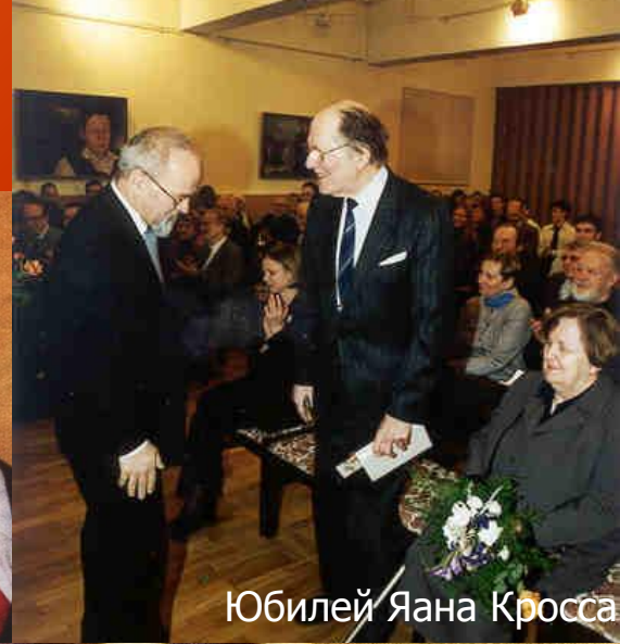
Юбилей Яана Кросса

В настоящее время Яан Кросс имеет множество литературных наград, является почётным доктором Тартуского и Хельсинского университетов, состоит в литературных союзах Эстонии и Финляндии. Его произведения переведены на множество языков мира.